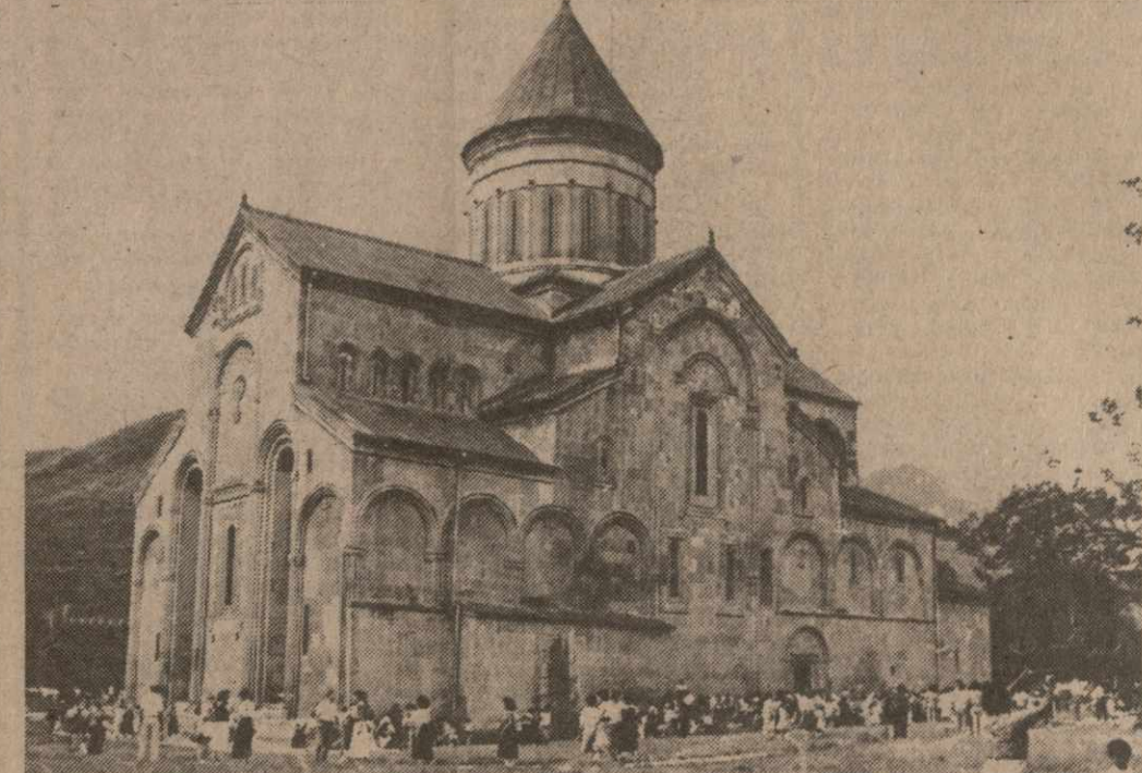
На снимках: Католикос-Патриарх Всея Грузии Илия II во время службы; древний кафедральный собор Светицховели. Фотохроника ИА «Сакართვეло» — Сакнформа и Рубена Рухкина.