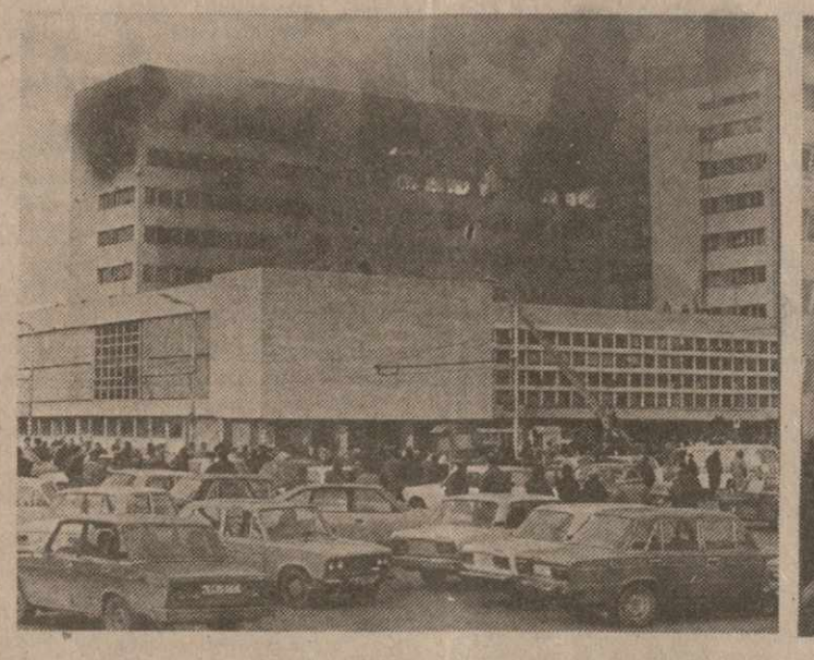
На снимках: во время тушения пожара в Тбилиском техническом университете.

Еще не улеглись страсти, связанные с пожаром в доме по ул. Хетагурова, в результате которого погибла женщина, а 20 семей остались без крова, и снова тревожит нас весть облетела город — пожар в корпусе № 66 Тбилисского технического университета. Первое сообщение о пожаре поступило на центральный пункт пожарной связи в 13 часов 53 минуты. К месту происшествия сразу же отправились несколько подразделений пожарной охраны города. В момент прибытия первых, а это было минуты через две после сообщения, огонь был охвачен весь девяти этаж и частично восьмой. При этом взрывались