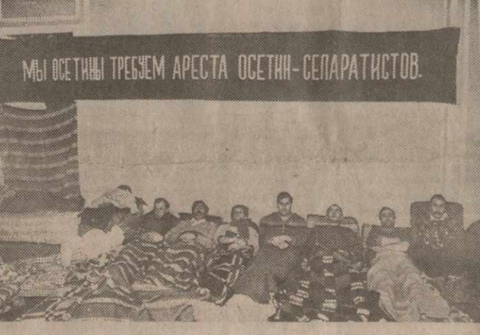
Мы осетины требуем ареста осетин-сепаратистов.

Такие любимые всеми новотворы и рождественские праздники, к сожалению, окрасились сегодня в черные тона.