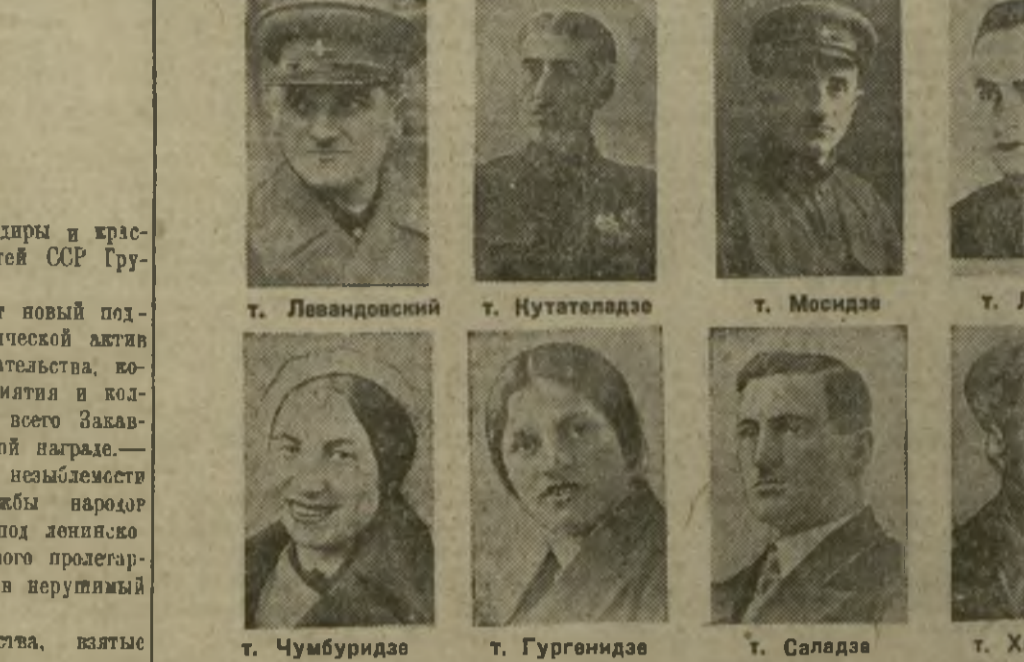
Члены делегации Советской Грузии, награжденные орденами

Растущим и незаменимым, великим историческим делом войдет в сознание каждого пролетария, каждого колхозника и труженика советской Грузии день встречи в Кремле делегации Грузии с великим Сталиным, с руководителем партии и правительства. Лучшие люди предприятий и колхозов, передовые представители трудового интеллигентии рассказывали с высокой трибуны Кремля великому вождю и учителю Сталину, руководителю партии и правительства о своих достижениях, о дальнейших задачах своей работы.