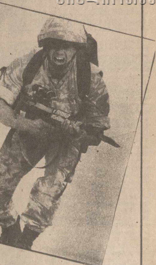
Иракская армия терпит крах. Если она не провит волю и желает сражаться, война будет окончена в три-четыре или пять дней», — отметил он, выступая в программе телекомпания Си-би-эс «Лицом к стране».

Итак, «бура в пустыне» превращается в шквал. Иракская армия терпит крах. Если она не провит волю и желает сражаться, война будет окончена в три-четыре или пять дней», — отметил он, выступая в программе телекомпания Си-би-эс «Лицом к стране».