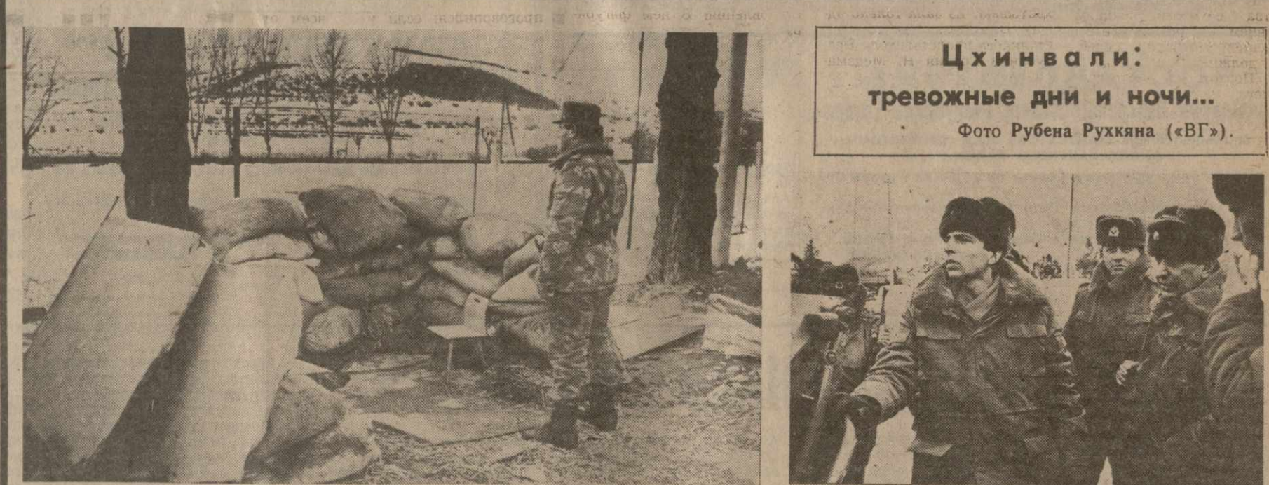
Цхинвали: тревожные дни и ночи...

Ваша же в сравнении судьба осетин и их национальной культуры в Северной Осетии? Там почти завершился процесс русификации.