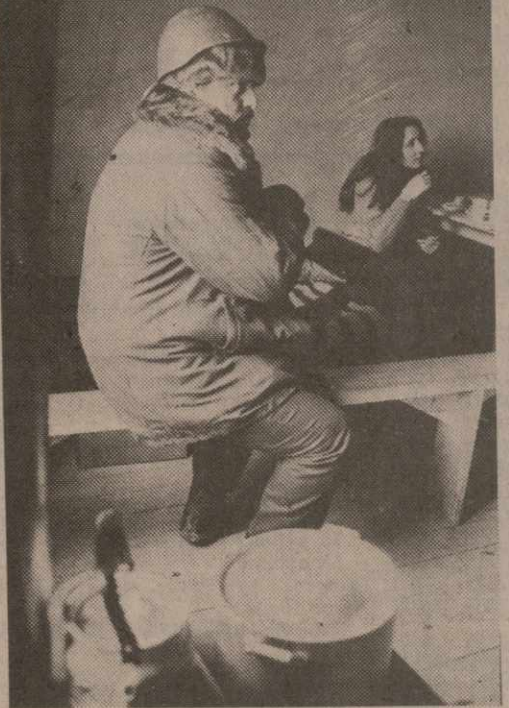
Цхинвали: тревожные дни и ночи.