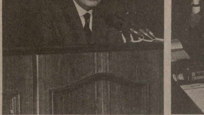
На снимках: во время пресс-конференции.

РАДИО ЭСТОНИИ: Батоно Звиад, если можно, задам такой вопрос. Год назад в интервью радио Эстонии Вы связывали создание