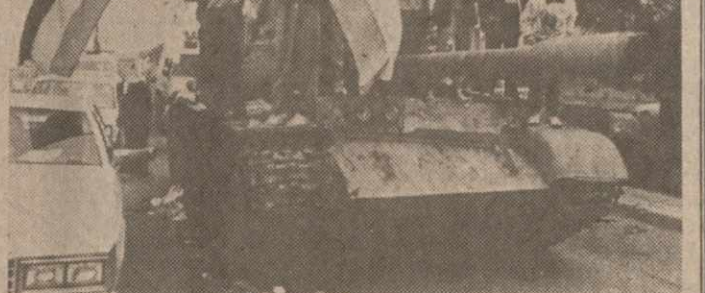
На снимке: ликуют жители Эль-Кувейта, давнишний должжданный мира.

Руководитель аппарата сотрудников Белого дома Джон Суинну заявил в интервью телекомпания Си-би-эс, что