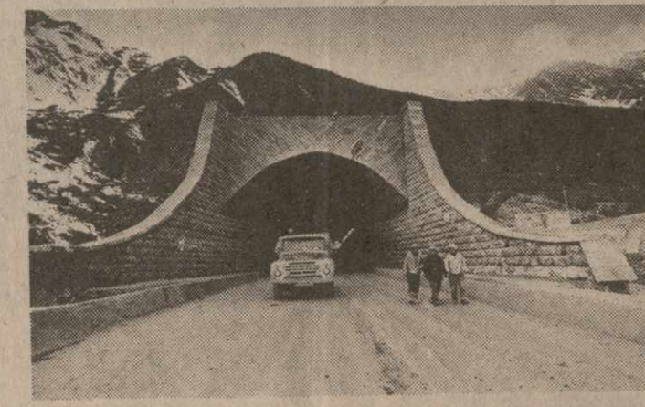
женье по тоннелю. Вы, кстати, так уверенно обещали это сделать участникам акции в «Заре Востока»...

— Изначне говорить о том, насколько меньше оружия попало бы в руки осетинских экстремистов, не будь Рокского тоннеля. Сейчас, конечно, ваше вмешательство в это дело уже не представляется возможным. Но ведь в свое время, согласитесь, был упущен реальный шанс перекрыть дви-