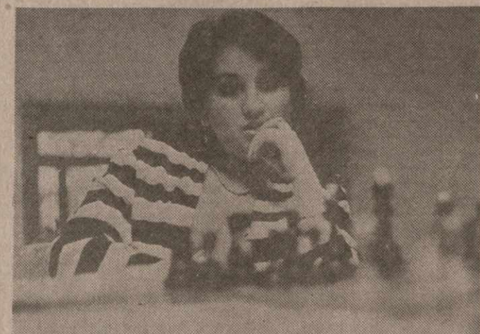
Действительно. Я послала телеграмму в адрес председателя Госкомспорта СССР Н. Рустава о том, что отказываюсь от всех привилегий и отныне буду выступать только под флагом Республики Грузии.

— У вас и ваших коллег шахматисток уже подготовлены все документы, по выходу из Всесоюзной федерации.