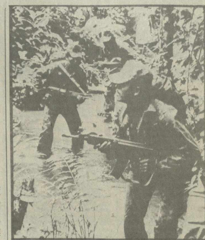
ПАТРИОТИЧЕСКИЕ силы Сальвадора продолжают наносить ощутимые удары по правительственным войскам в различных районах страны. Как сообщает радиостанция повстанцев «Венсеремос», отряды Фронта национального освобождения имени Фарабуно Марти (ФНО) в результате ожесточенных боев освободили ряд крупных населенных пунктов в департаментах «Сан-Мигель, Усулутан и Морасан». На снимках из журнала «Камбио-16»: эпизод боевой операции; партизаны перед выходом на задание.