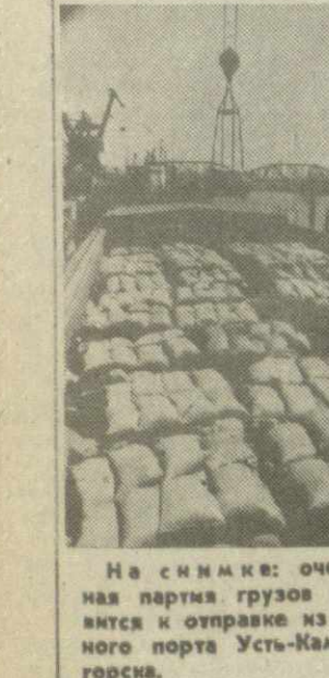
На снимке: очередная партия грузов готовится к отправке из речного порта Усть-Каменогорск.

Еще не стихла боль последствий землетрясения в Восточном Казахстане. Оперативная работа чрезвычайных комиссий помогла в короткие сроки обеспечить пострадавших продуктами питания, промышленными товарами, палатками для временного жилья.