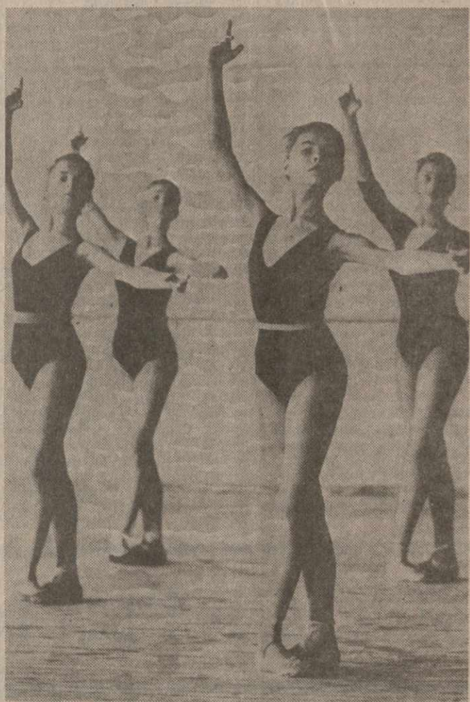
ЮНЫЕ ГРАЦИИ.