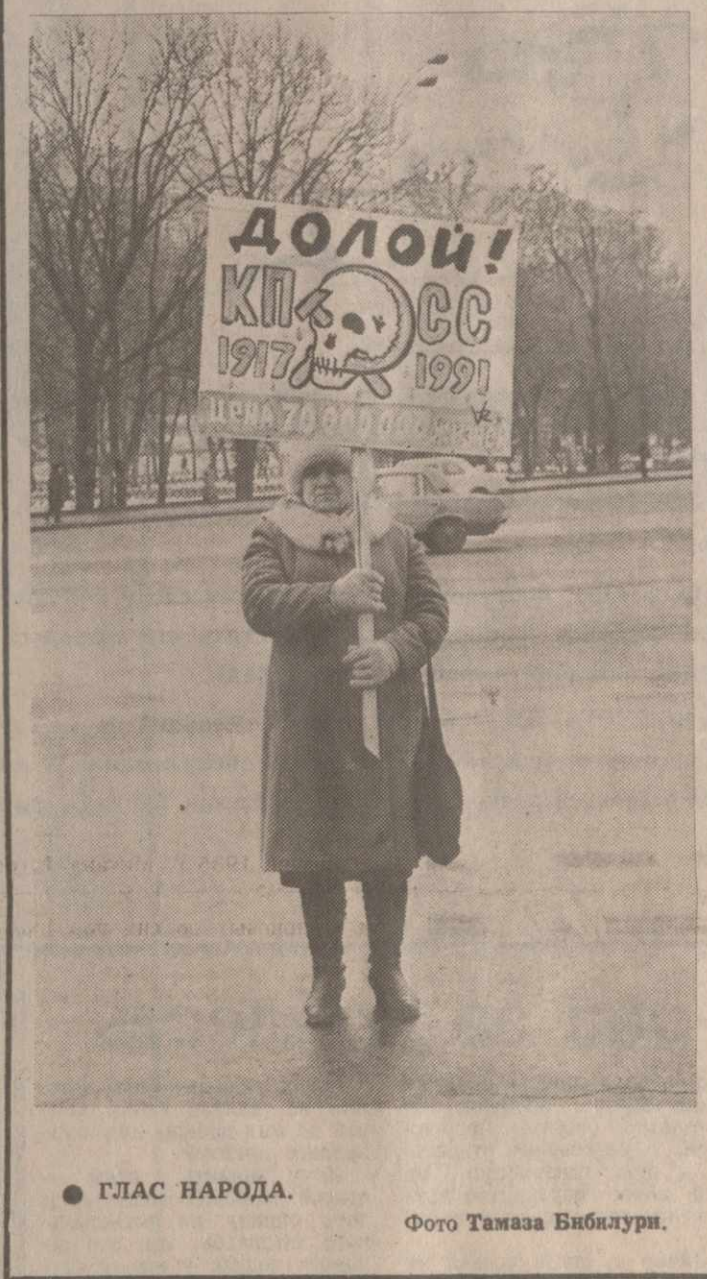
● ГЛАС НАРОДА.

(Из выступления на встрече в Москве грузинских писателей с представителями общественности и творческой интеллигенции России).