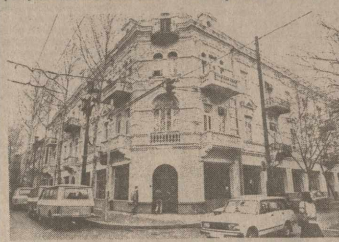
Инициативу его создания поддержали Председатель Верховного Совета Республики Грузии Зинаид Гамсахурдия, первый заместитель Председателя Верховного Совета Акакий Асатиани и Председатель Правительства республики Тенгиз Сигуа.

Акция милосердия, которая проходила во дворе Кахетинской церкви с мая 1990 года, является первым этапом гуманитарного движения Орден милосердия; следующим стало открытие 23 марта в Тбилиси Дома милосердия республиканского значения.