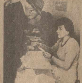
31 марта 1991 года состоялся референдум по вопросу восстановления государственной независимости Грузии и выборы местных органов власти.

На снимках: голосует Председатель Верховного Совета Республики Грузия Зинаид Гамсахурдия; Батуми. Все 22 моряка танкера «Аспид» Грузинского морского пароходства отдали голоса за независимую и свободную Грузию; во время голосования на избирательном участке в избирательном округе Исаевского района г. Тбилиси.