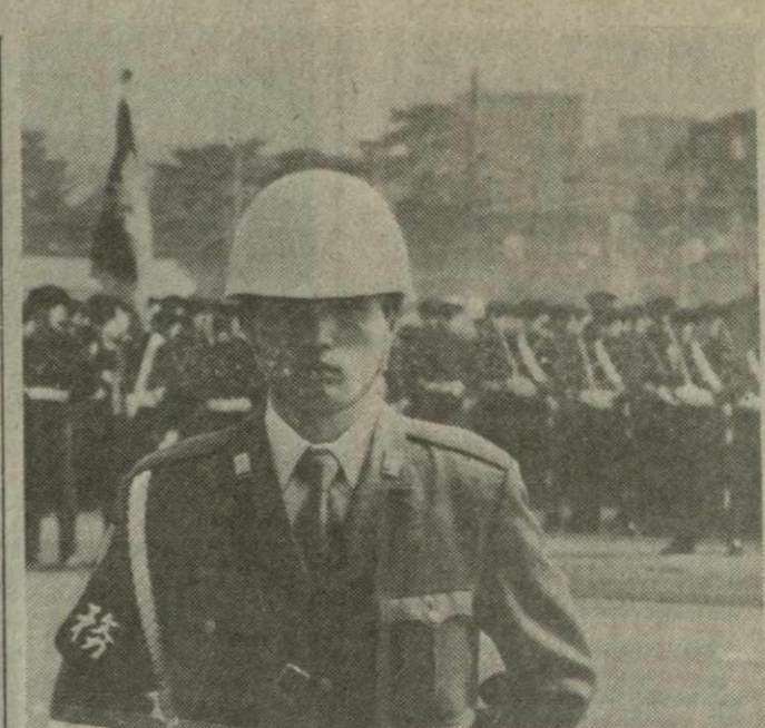
Военное ведомство разработало программу модернизации вооруженных сил. Согласно этой программе, японские «силы самообороны» стали по сути мощной и хорошо вооруженной армией.