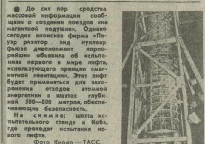
До сих пор средства массовой информации сообщали о создании поездов «на магнитной подушке». Однако сегодня японская фирма «Тазури» разработала проект лифта, использующего принцип «магнитной левитации». Этот лифт будет применен для загрузки отходов атомной энергетикой в шахтах глубиной 500-800 метров, обеспечивая безопасность.

ИНФОРМАЦИЯ ИЗ ДОМА ПРАВИТЕЛЬСТВА ЗАРЕГИСТРИРОВАНА КОРПОРАЦИЯ «МАЦНЕ» Правительство республики зарегистрировало информационную корпорацию Грузии «Мацне».