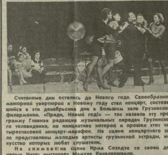
Считанные дни остались до Нового года. Своеобразной мажорной увертюрой к Новому году стал концерт, состоявшийся в эти декабрьские дни в Большом зале Грузинской филармонии. «Приди, Новый год!» — так назвала эту программу Главная редакция музыкальных передач Грузинского телевидения, по инициативе которой и прошел этот чл-тырчасовой концерт-марафон. На сцене концертного зала представлены молодые артисты грузинской эстрады, искусство которых любят слушатели.