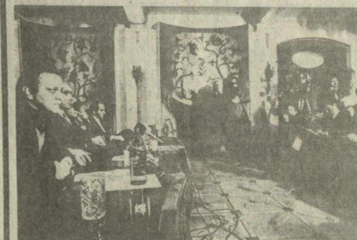
На снимке: во время пресс-конференции.