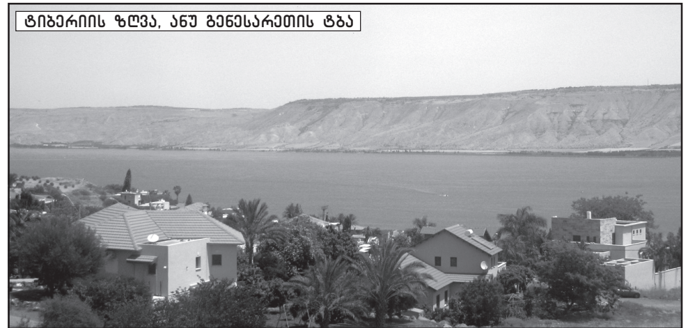
ტიბერიის ზღვა, ანუ გენესარეთის ტბა

ნასოდომარ, ნაგომორალ სივრცეზე ზღვა დაიღვარა, ზღვა მარილიანი, ზღვა უჩვეულო, ზღვა ცხოველმყოფელობას მოკლებული, მკვდარი ზღვა, რომელშიც დღესაც არ იძვრის სიცოცხლის ნიშანწყალი, მაგრამ... ისიც საოცრებაა ღვთისა: