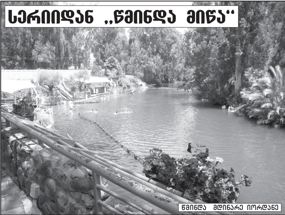
წმინდა მდინარე იორდანე

როდესაც მდინარე იორდანეს სანახებში დააბიჯებ და შეიგრძნობ მის ღვთიით ნაბოძებ მადლს, არ შეიძლება ყოველი შენი ნაბიჯი მოკრძალებული არ იყოს. აქ ყოველ მტკაველზე სუფევს, თითქმის დაუჯერებელი საოცრების სინამდვილე.