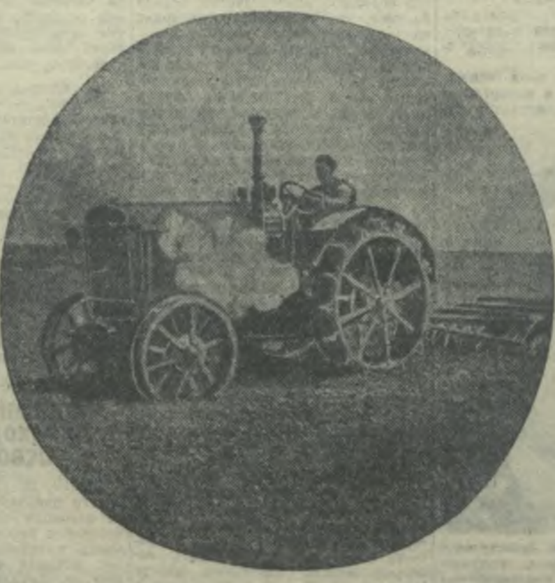
Колхоз им. Мухоморова. Али - Бирманлинского района, закончи- вает сев агитского хлопна. На снимке: борозвание агрономных хлопковых массивов хлопна.

У ярко освещенного подвала стоят шесть гру- зовых машин с уложенными по- перек кузовов до- вериями спелыми малышами. Эти принадлежат кол- хозам. На них се- годня колхозни- ки прехали в районный центр. Пройдя вестиб- ль, гости на несколько минут задерживаются в просторном зале. Стильная охра- са стен, краси- вые люстры, пор- тены, удобная мебель, буфет, в котором про- длагают диномат ме- стного пропе- дства, охлаж- денный на льду, с находящегося рядом завода. На столах послед- ние номера газет и журналов. На стенах — карти- ны и портреты.