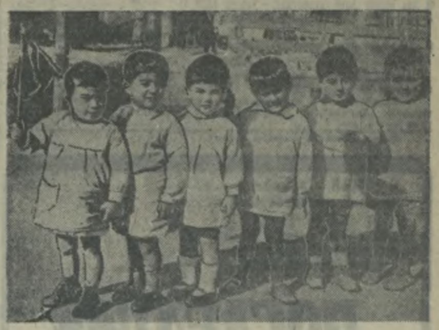
Зрители. Детские исли работников.

пагах от станции и стоит на горе. Жизнь им в замечательном доме былого помещика. Директор купил две базальки, гармонию, есть гитара, мандолина, патефон. Так, что после работы мы очень весело проводим время. Спасибо советской власти, направившей нас на правильный путь, давшей нам счастливую и радостную жизнь.