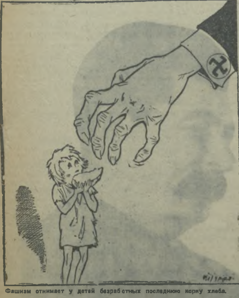
Фашизм отнимает у детей безработных последнюю корку хлеба.