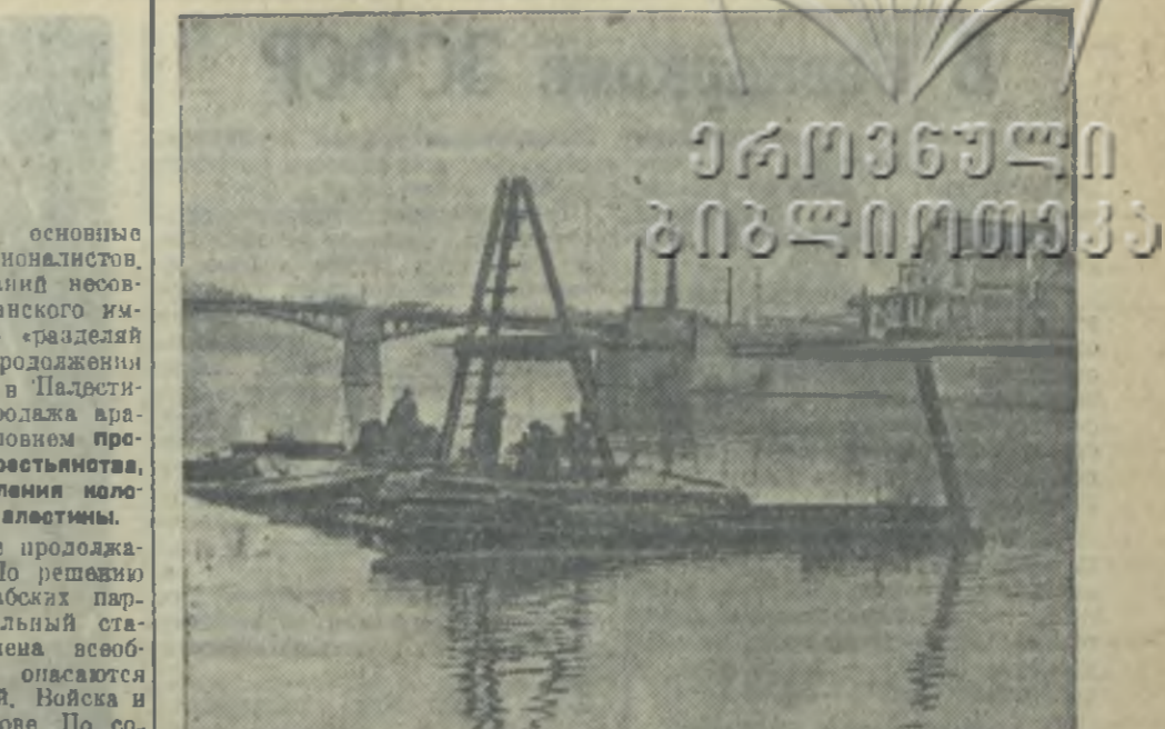
Самым ответственным участком Арбатского района строительства 2-й очереди метро является 12-я дистанция, отгораживающая два вокзала и метрополитен. Поезда, идущие от станции «Смоленские площади», выйдут и набережной Москварики, где будут сооружены вокзалы, метрополитен и вторая эстакада на другом берегу. Пройдя эстакады и метрополитен, поезде метрополитена сменя выйдут в тоннель, который закончится у Киевского вокзала. На снимке: буровая вышка на Москва-реке. (Сокофот).

К строительству института в Багдаде будет приступлено в ближайшее время. Первая очередь должна быть, согласно постановлению