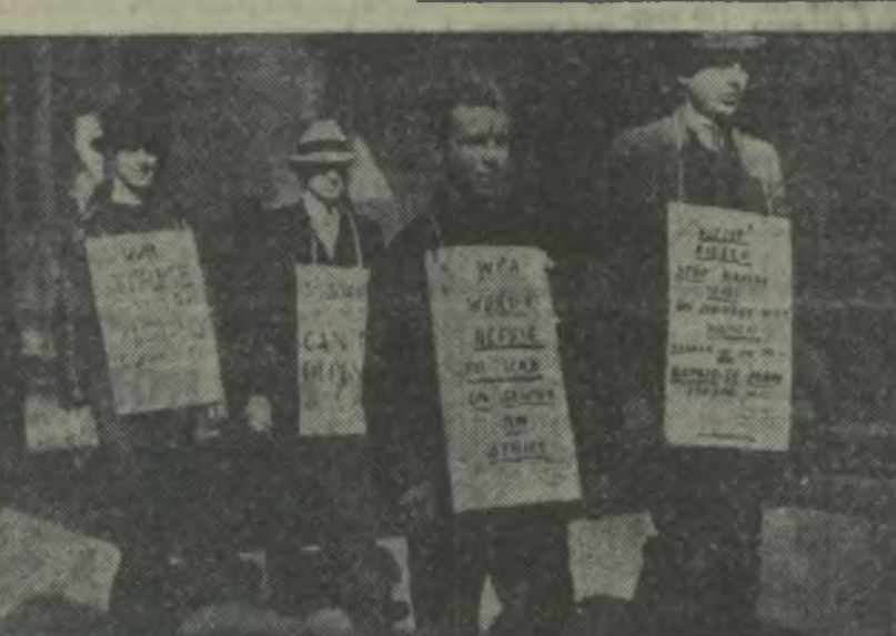
В знак протеста против увольнения нескольких матросов весь экипаж американского парохода «Налифорин» объявил забастовку, и которой примкнули и экипажи других пароходов. На снимке: пикет стачечников в Нью-Йорке.