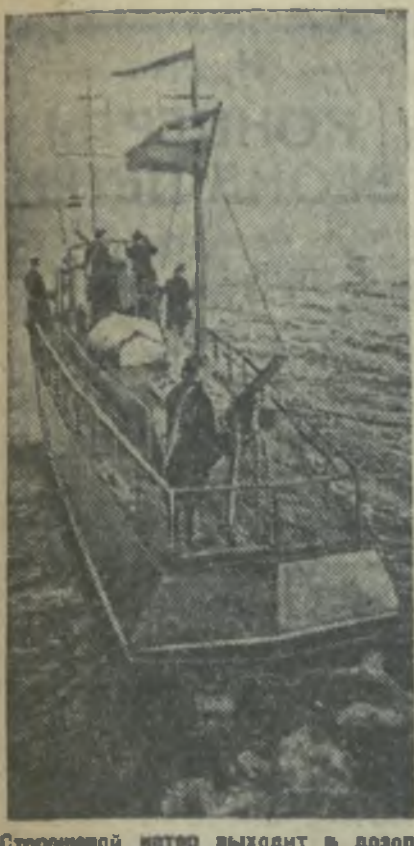
Стержень интер выводит в дозор.