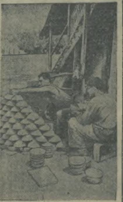
Глазувание глиняных чашек в мастерской тифлисской керамической студии...