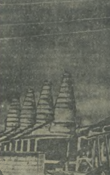
В Янино вступил в пусковой период карбидный завод, являющийся одним из цехов строящегося комбината синтетического каучука. Карбидный завод вступил в промышленную эксплуатацию с пуском Намангирской гидроэлектростанции, которая даст ему энергию. На снимке: печи карбидного завода.

Новорожденные помещаются в специальных дощатых палатах и их приносят к матери только на время кормления грудью. Система изоляции новорожденных хороша тем, что с одной стороны, она дает покой матери, а с другой — предупреждает распространение кишечника детей от частого и беспорядочного кормления.