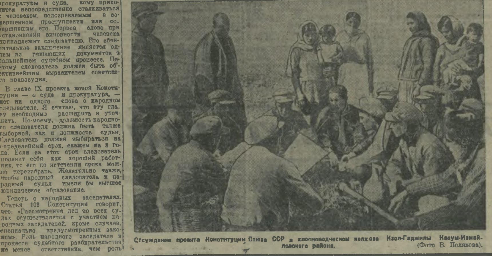
Обсуждение проекта Конституции Союза ССР в колхозном клубе Инал-Гаджили Исам-Исамовского района. (Фото В. Полякова).

В городе Дзугдети в прошлом году открылись форские курсы. Они были укомплектованы рабочими, оплату кураторов производила администрация предприятий.