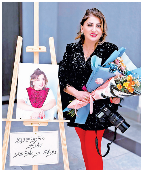
დღეს პასუხიმგებლობასთან იყო დაკავშირებული... იყო ემოციები, ნერვიულობა, სიხარულის ცრემლები. რასაც ვასკვამ, ის გასამგებლად არ დაგებრუნდეს, უბრალოდ, შეუძლებელია. ამიტომ ვამბობ ხშირად და ისევ განვმეორებ, სიყვარულში, მადლიერებაზე დიდი ბედნიერება არ მეგულება. ყველას დიდი მადლობა დღევანდელი დღისთვის, „სილამაზე - ჩარჩოების გარეშე“ ნამდვილად და ეს დავინახეთ ამ ფოტოებიდანაც. ჩემთვის ყველაზე დიდი ბედნიერება ამ ფო-