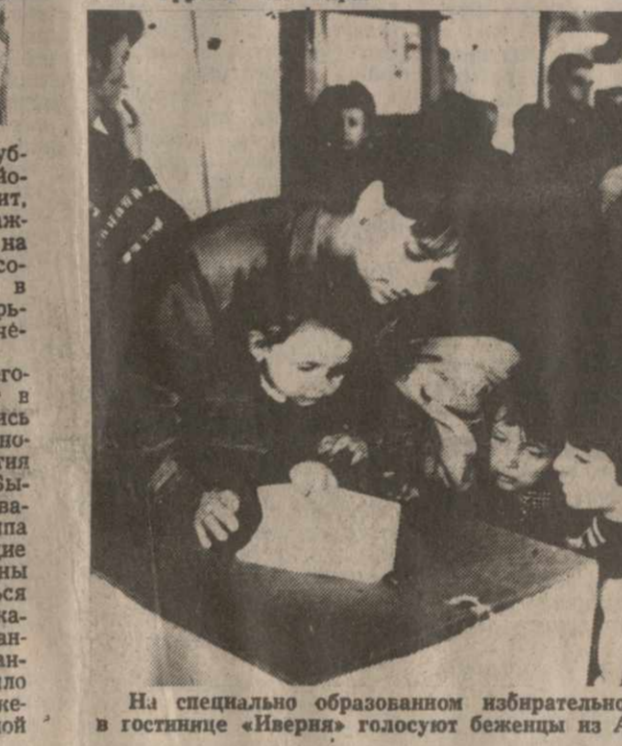
На специально образованном избирательном участке в гостинице «Иверия» голосуют беженцы из Абхазии.

Давно на улицах Сухуми не было так многолюдно, как в минувшее воскресенье. С утра тысячи граждан различных национальностей пришли на избирательные участки города (а их в Сухуми было 47), чтобы принять участие в выборах в парламента Грузии. Не оправ-