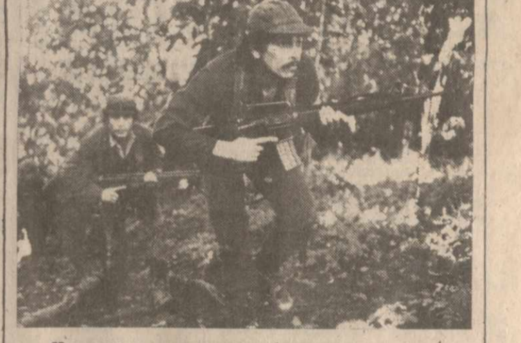
На снимке: коммунистические партизаны готовят террористическую акцию.