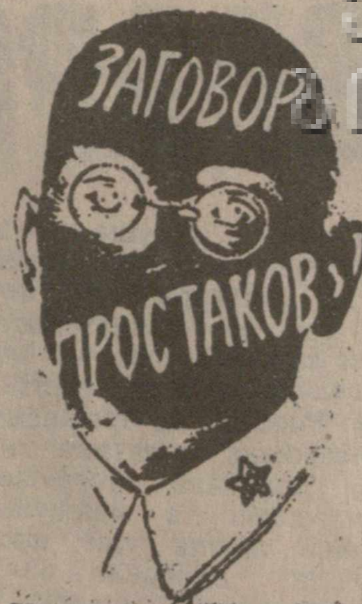
Хроника дворцового переворота