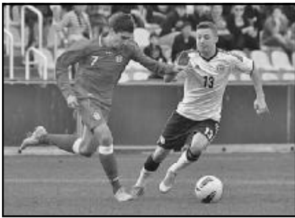
ამჯერად „დუბლი“ შეასრულა და დიდი წვლილი შეიტანა პარტნიორთა წარმატებაში.

მათ სასახელოდ უნდა ითქვას, რომ ვაკის მიხეილ მესხის სახელობის სტადიონის სარბიელზე მხოლოდ მოსაგებად გავიდნენ და მეტოქეს ღირსეული გაკვეთილი ჩაუტარეს - 3:0. გუნდის ლიდერმა ლუკა ზარანდიამ