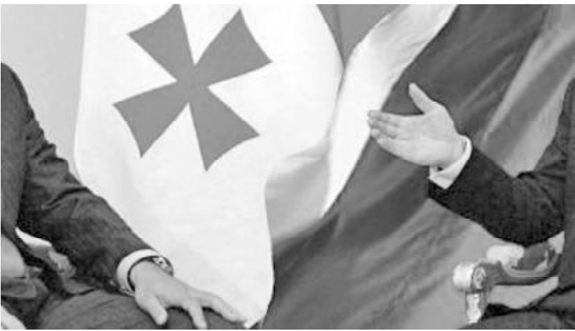
ივანიშვილი - ივანოვის ფორმატი და საქართველო - რუსეთის დიალოგი