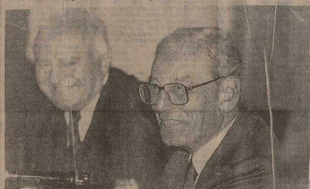
Как считает лидер Союза