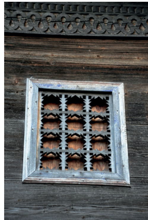
ორნამენტული დეკორი (ქედა)

of the frame of horizontal, vertical and slant wooden piles, the color of the stone. The type of Laz house was most characteristic of the village of Sarpi inhabited by the Laz. However, modern two-story houses built on the basis of earlier dwellings are widespread here today. It is noteworthy that in the transitional regions of Upper Adjara, the so-called residential houses with Laz-Ajarian tradition (Keda - villages Makhuntseti, Zundaga, Vayo, Chinkadzebi; Khelvachauri - villages Vake, Skurdidi; Shuakhevi - Furtio, Oladauri, etc.), which are characterized by a façade solution with a timber frame and piles of stones.