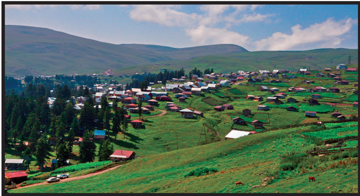
ალპური დასახლება აჭარაში (ბეშუმი)