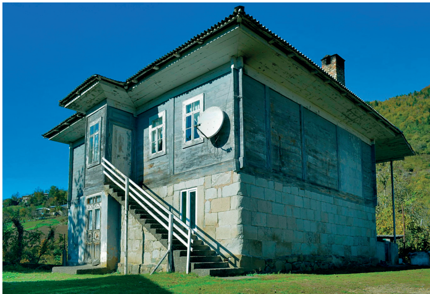
სოფელი ჩიქუნეთი (ხელვაჩაური) Village of Chikuneti (Khelvachauri)

დასავლეთ საქართველოს სხვა კუთხეებთან შედარებით აჭარის საცხოვრებელ ნაგებობებს გამოარჩევს მინიმალისტური დეკორატიული შემკულობა, თუმცა საცხოვრებელი სახლების ინტერიერში გვხვდება ჭერის ორიგინალური ხონჩისებური შემკულობა, კედლებში გამართული თახჩებისა და კარადების, ფანჯრის დარაბების („სურმების“), კარ-ფანჯრის საპირეების, აივნების, ხის სვეტების, მოაჯირების, სახურავის შვერილი კარნიზის („სარაიბალის“) ჩუქურთმით მორთვის ტრადიცია.