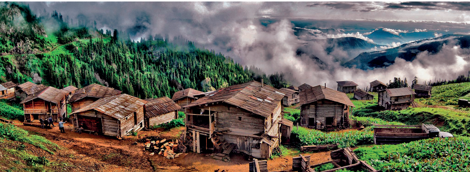
ალპური დასახლება აჭარაში