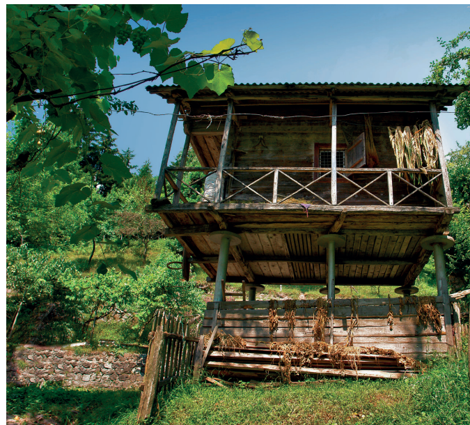
ნალია. სოფელი ჭალა (შუახევი)

A Wine Cellar. Village of Chikuneti (Khelvachauri)