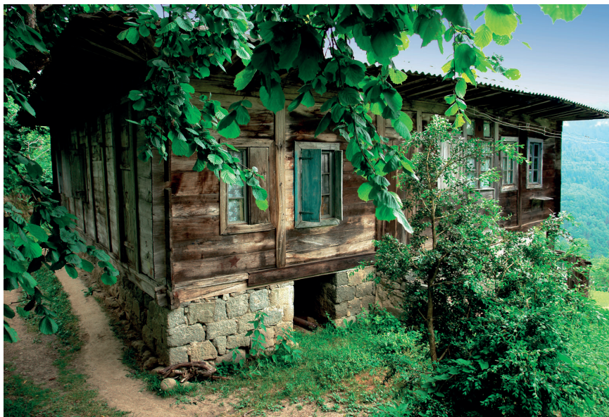
სოფელი ჩხუტუნეთი (ხელვაჩაური)