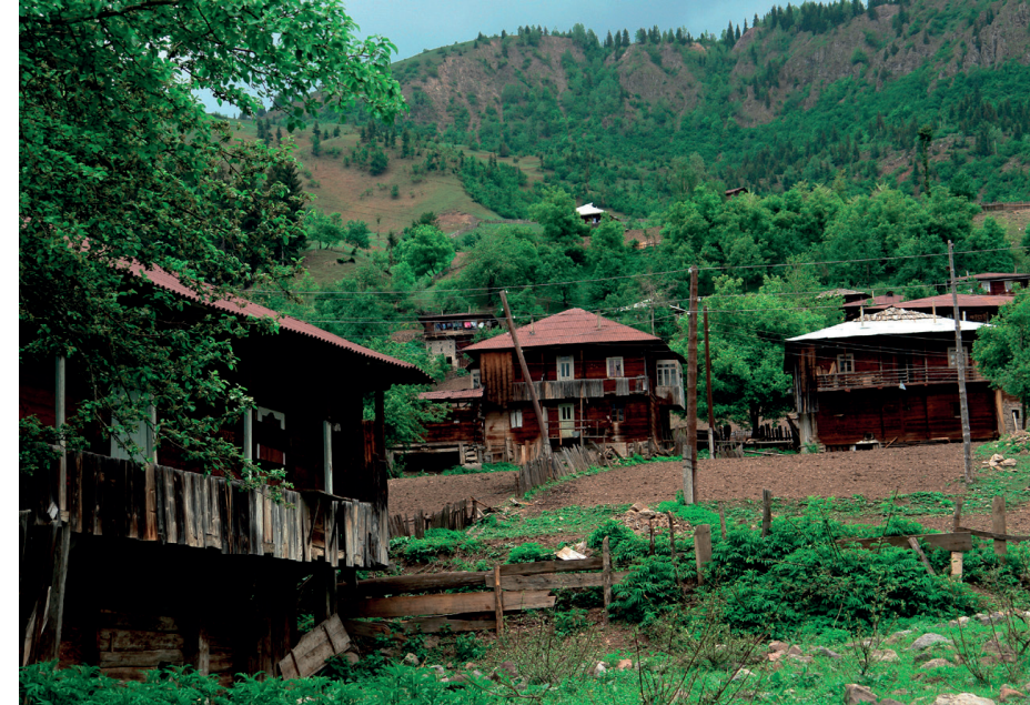
Village of Tkhilvana (Khulo)

One of the most beautiful corners of Georgia - Ajara is distinguished by its azure coastline, mountain ranges hidden in greenery, river valleys, pure springs, rushing waterfalls, villages scattered on the mountains, alpine meadows and amazingly hardworking, kind, hospitable people.