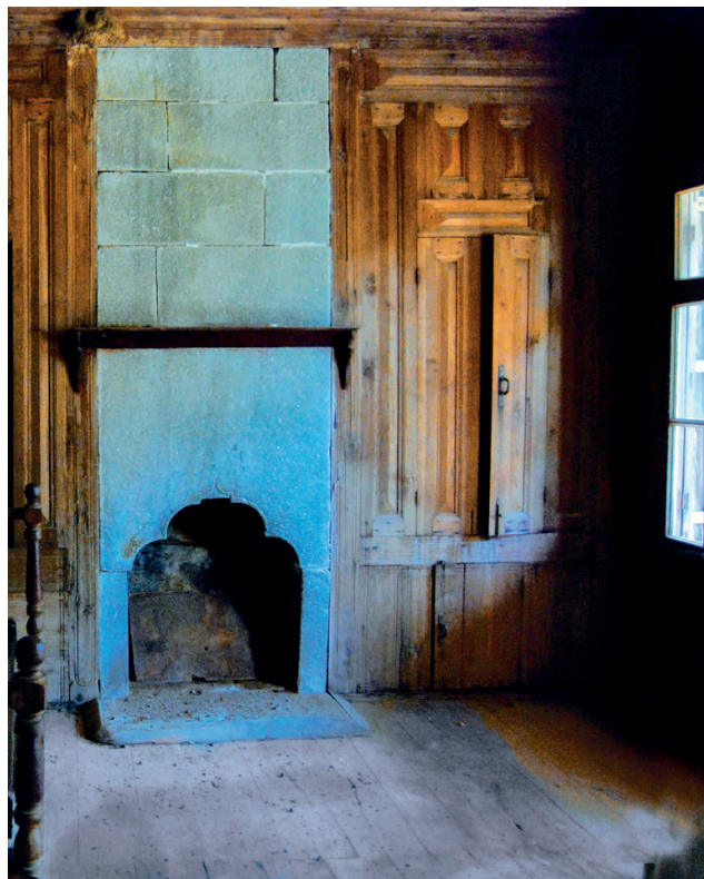
აჭარული სახლის ინტერიერი (ჩაქვი) Interior of an Ajarian House (Chaqvi)

აჭარულსახლებსადახისმეჩეთებში დადასტურებული ორნამენტული ჩუქურთმები, ორიგინალურად შემკული ბუხრის ქვები ძირითადად ლაზი ოსტატების ნახელავადაა მიჩნეული. XIX საუკუნესა და XX საუკუნის დასაწყისში ლაზები საუკეთესო მშენებელ ოსტატებად და ხის ნაკეთობათა „უსტებად“ იყვნენ მიჩნეული. მათ მიერ აგებული ხის სახლები, ეკლესიები და მეჩეთები დღემდეა შემონახული საქართველოს სხვადასხვა კუთხეში (იმერეთი, გურია, სამეგრელო, მესხეთი). საცხოვრებელ და საკულტო შენობებზე, საყოფაცხოვრებო ნივთებზე დატანილი რელიეფური და ჭვირული ტექნიკით შესრულებული ორნამენტი, მცენარეული, ზოომორფული მოტივები, ციურ მნათობთა გამოსახულებები წარმოაჩენს ქართველთა უძველეს მითოლოგიურ რწმენა-წარმოდგენებს სამყაროს შესახებ. ზოგჯერ სახლების საკრალურ კერას - ბუხრის თავს ამკობს წარწერები, ყვავილოვან-ფოთლოვანი მოტივები, სიცოცხლის ხის, მზის, წყლის, მიწის, მთის, თოფის, ხმლის ან სხვა პირობითი გამოსახულებები, რაც ბოროტი ძალებისაგან დაცვის ფუნქციის გარდა ადასტურებს, რომ ისლამის გავრცელების პერიოდშიც (XVII-XIX სს), აჭარაში შენარჩუნებული იყო ქართველთა ხატოვანი აზროვნებისათვის დამახასიათებელი საგნობრივი ნიშან-სახეობრივი სისტემა.