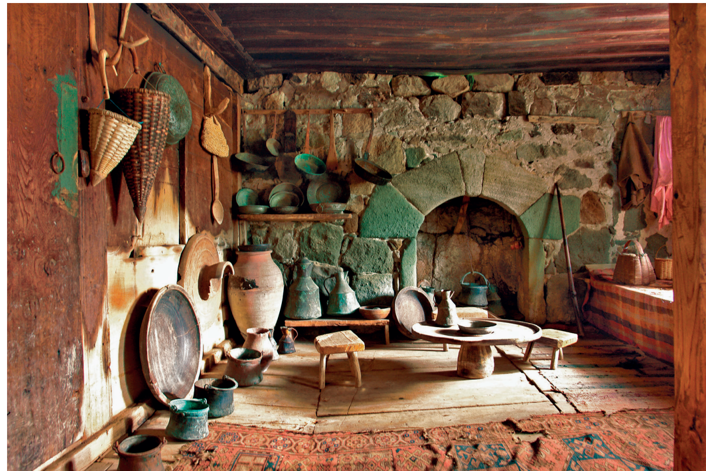
The Alpine Settlement in Ajara