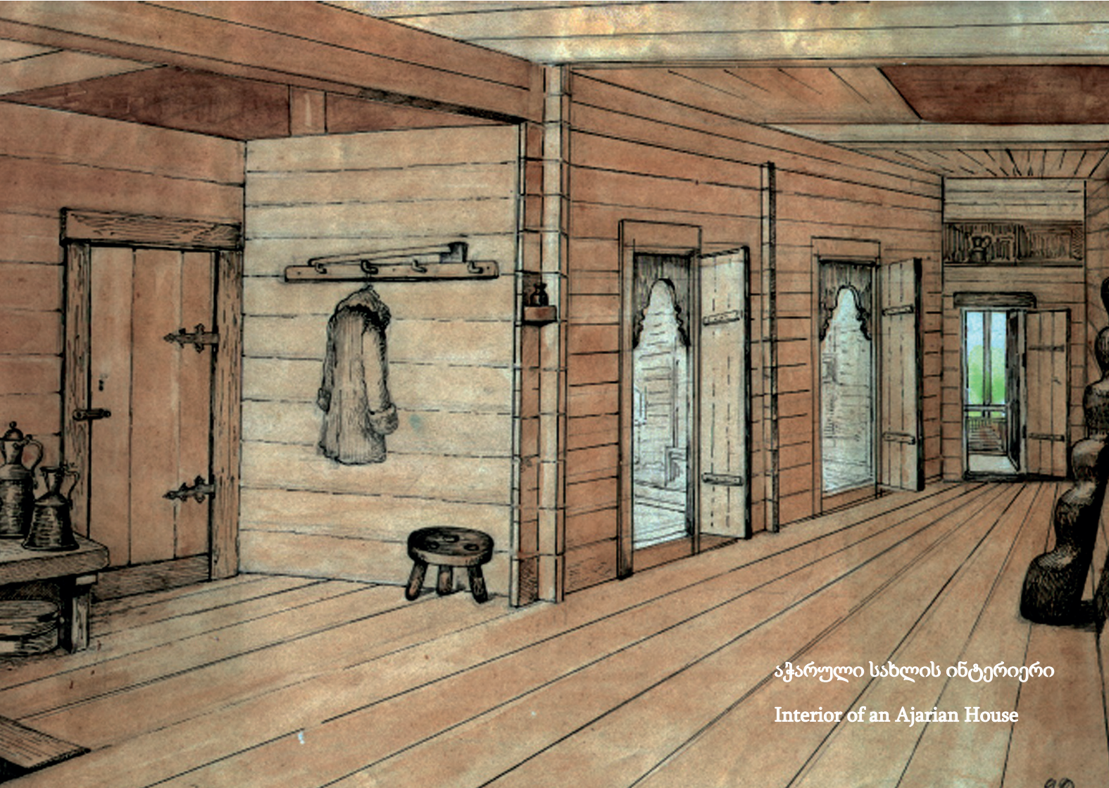
აჭარული სახლის ინტერიერი Interior of an Ajarian House