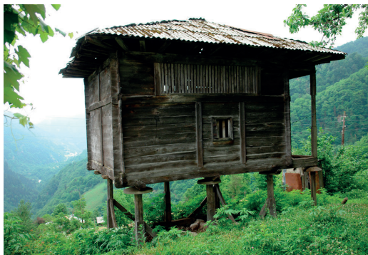
ნალია.სოფელი ჩხუტუნეთი (ხელვაჩაური) A Barn. Village of Chkhutuneti (Khelvachauri)

საცხოვრებელი საკარმიდამო კომპლექსების განუყოფელი ნაწილია ხითხურობის მაღალი ტრადიციების მქონე სამეურნეო დანიშნულების ნაგებობები - ახორი /ზოსელი (საქონლის სადგომი), საბძელი (პირუტყვის საკვების შესანახი სათავსი), ბეღელი და ნალია (მარცვლოვანი კულტურების შესანახი ნაგებობა), წყლის წისქვილი, ქვით ნაგები საოჯახო ფურნე, რომელიც აჭარის სინამდვილეში მკაცრი კლიმატური პირობების გავლენის ნიადაგზეა წარმოშობილი და სპეციალურად სიმინდისა და ხილის სახმობადაა გათვალისწინებული.