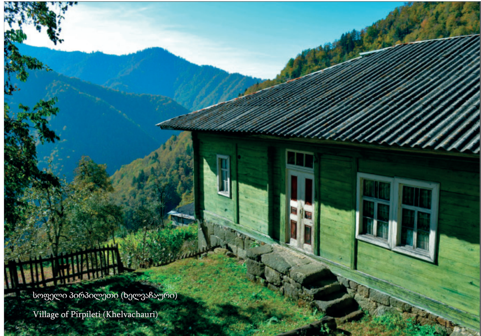
სოფელი პირპილეთი (ხელვაჩაური)

აჭარის ამავე სამხრეთ-დასავლეთ სანაპირო ზოლში გამოარჩევენ ლაზური ტიპის საცხოვრებელ სახლებს („ოხოი“), რომელიც წარმოადგენდა ერთ ან ორსართულიან სახლს ქვით ნაგები ქვედა სართულით, ღია დატოვებული ვერანდით, საჯალაბო დარბაზითა და თიხატკეპნილ იატაკზე კერით, რომელსაც მოგვიანებით ჩაენაცვლა დარბაზის მთავარი ატრიბუტი - მოზრდილი ფორმის, გარეთ გატანილი ტანის მქონე „ლაზური ბუხარი“. თლილი ქვის ნახევარწრიული თაღით შემოსაზღვრულ ლაზურ ბუხარს არ ახასიათებს ე.წ. თარო, ლავგარდანი, რომელიც კოლხეთის ოდა-სახლების ბუხრების აუცილებელი ელემენტია.