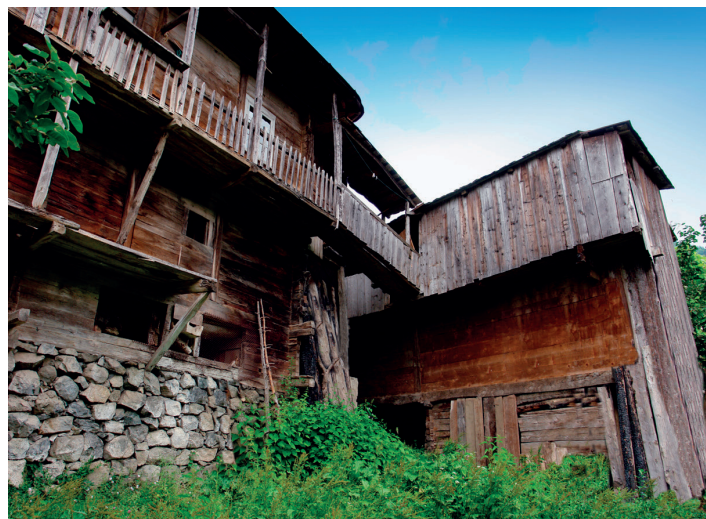
სოფელი ხაბელაშვილები (შუახევი)