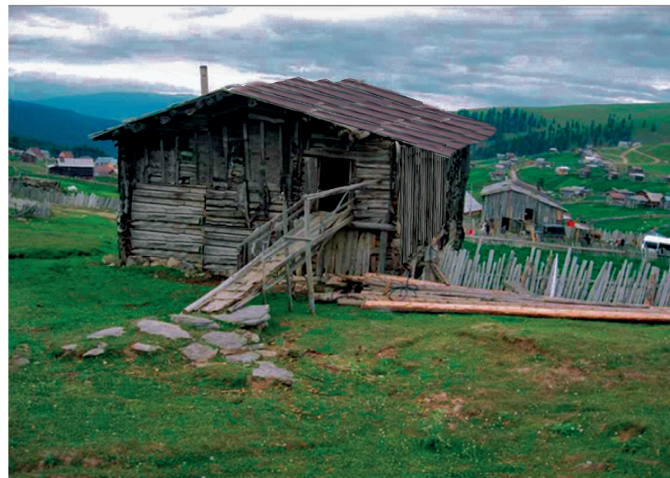
ალპური დასახლება აჭარაში. იაილა (ბეშუმი) The Alpine Settlement in Ajara. Yaila (Beshumi)

აჭარის საცხოვრებელი კომპლექსების ვერტიკალურ-ჰორიზონტული პრინციპით დაყოფის შედეგად გამოარჩევენ რამდენიმე ზოლს და აჭარულ, ლაზურ და ოდა-სახლის ტიპის საცხოვრებლებს. მეურნეობის ტრადიციული სახეები გავლენას ახდენს თითოეული ზოლისთვის დამახასიათებელი საცხოვრებელი ტიპის ჩამოყალიბებაზე. ქვემო აჭარაში - მიწათმოქმედება, ხოლო ზემო აჭარაში გავრცელებული მესაქონლეობა განაპირობებს საცხოვრებლის განსხვავებულ ფუნქციურ გადაწყვეტას.