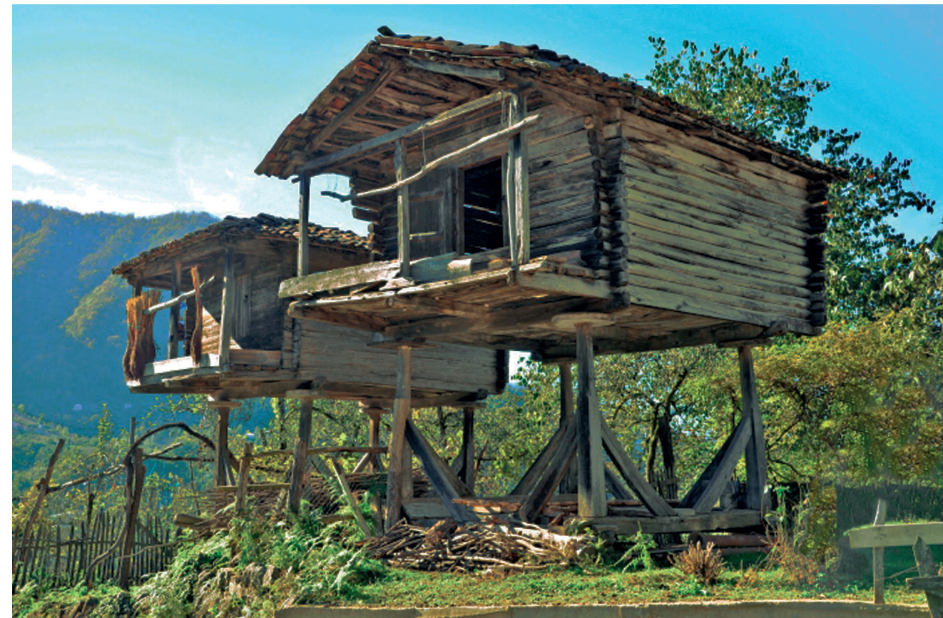
ნალია. სოფელი ჩიქუნეთი (ხელვაჩაური)

ნალია-სასიმინდე - ღომის, ფეტვის, მოგვიანებით - სიმინდის გასახმობად გამოსაყენებელი შენობაა, ჭდობით შეკრული ხის სარტყლებზე დამყარებული ხის ბოძებით, ორქანობა ან ოთხფერდა გადახურვის მქონე ფიცრული სწორკუთხა სათავსით, რომელსაც ეკვრის აივნები - ერთი, ორ ან იშვიათად - სამივე და ოთხივე მხარეს. მოხდენილი პროპორციებითა და ოსტატობით გამორჩეულ ზოგიერთ ნიმუშს დეკორატიული შემკულობაც ახლავს. გამჭოლი განიავების მიზნით, ფიცრულ კედლებს პარალელურ მხარეებზე ვიწრო ჭუჭრუტანები ან ჭვირული დარაბები გასდევს. სასიმინდის სართულში ასვლა მისაყუდებელი კიბით შეიძლება.