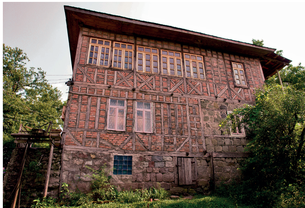
სოფელი ფურტო (შუახევი)

დასავლეთ საქართველოს სხვა კუთხეებთან შედარებით აჭარის საცხოვრებელ ნაგებობებს გამოარჩევს მინიმალისტური დეკორატიული შემკულობა, თუმცა საცხოვრებელი სახლების ინტერიერში გვხვდება ჭერის ორიგინალური ხონჩისებური შემკულობა, კედლებში გამართული თახჩებისა და კარადების, ფანჯრის დარაბების („სურმების“), კარ-ფანჯრის საპირეების, აივნების, ხის სვეტების, მოაჯირების, სახურავის შვერილი კარნიზის („სარაიბალის“) ჩუქურთმით მორთვის ტრადიცია.