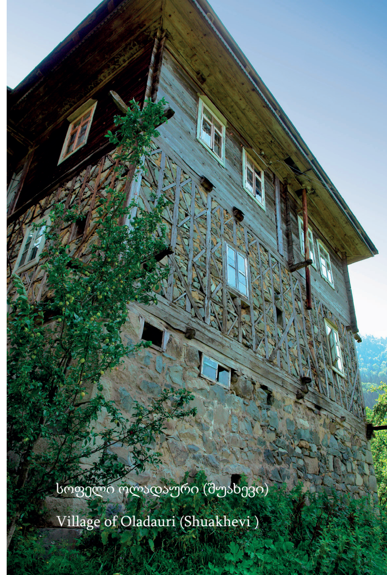
სოფელი ოლადაური (შუახევი)

In the alpine and subalpine zone, one-story and two-story wooden residential buildings are common on the summer pastures, with separately arranged cow-shed or "yaili" (a one-story or two-story house set up on summer pastures) type with a cowshed in the lower stall. Confirmed in the mountain zone (south-eastern zone, Kobuleti highland Khino settlement) the so-called "Ajarian-type" residential house is a composite complex with residential and farm buildings of various purposes combined in it: khalkhami floor (stony cowshed), chamber – akhori(stud), living part and attic floor for winter barn. A characteristic feature of the Ajarian house is the vertical organization of the building complex and the segmentation of the living space with rooms located on two sides of the corridor, with the following parts - the master's house and the kitchen, a newly-wed couple's room, a storage room for products 'sardzie', and a guest room with a distinguished decoration.