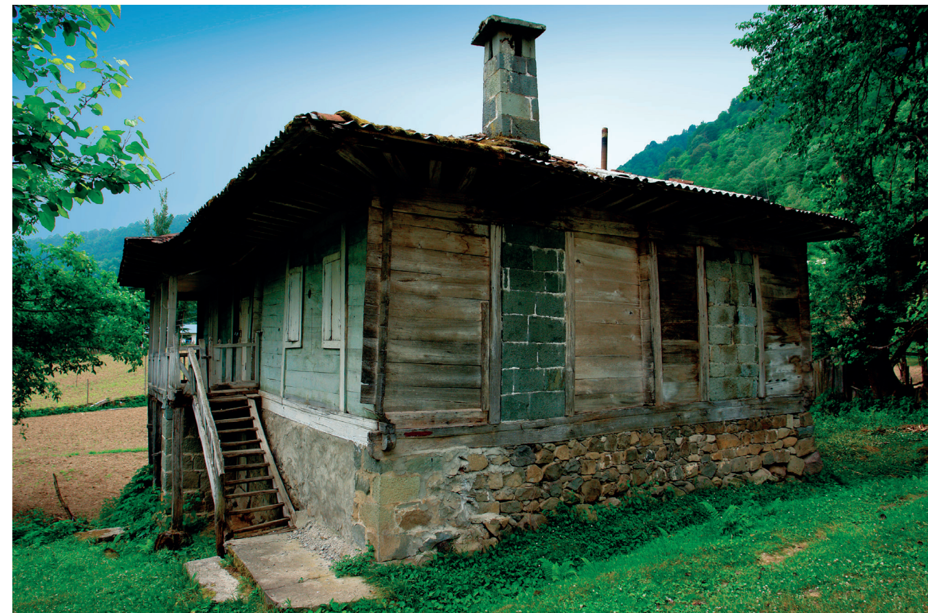
სოფელი ჩხუტუნეთი (ხელვაჩაური)

აჭარის საცხოვრებლის მეორე ზონაში ახორის ნაცვლად მარანი ან სამეურნეო ტიპის სათავსია, რაც მიწათმოქმედების, მევენახეობა-მეღვინეობის ტრადიციული დარგების დომინანტურობას ადასტურებს. ქედა-ხელვაჩაურის ზონის საცხოვრებელი სახლები დაგეგმარებით აჭარული სახლის ტიპისაა, თუმცა ისინი ნაგებია შერეული მასალით. ამავე ზონაში გავრცელებულია აჭარული სახლის გეგმის მქონე ე.წ. ციხე-სახლები, რომელთაც ახასიათებს ქვითა და კირხსნარით ნაგები პირველი სართულის პალატები ბუხრებითა და ხეობებისკენ გახსნილი, ზოგჯერ სათოფურების მსგავსი, თაღოვანი სარკმლებით. შენობებს გამოარჩევს ლანდ- შაფტს მორგებული მდებარეობა, ფასადების განსხვავებული მოცულობები, მაღალი სამშენებლო კულტურა, კარგად დამუშავებული ქვის კვადრების წყობა, ფორმების ოსტატობა. მთის ფერდზე შეფენილი სახლების თავისებურებას სივრცესთან განუყრელობა და გარემოს ულამაზესი ხედებით ტკობა წარმოადგენს. საცხოვრებელი შენობების ინტერიერიდან ხეობების შორი პანორამა იშლება. სივრცისკენ სწრაფვის გამოხატულებაა საცხოვრებელი სახლების გახსნილი ვერანდებიც. ამავე ზონაში საკარმიდამო კომპლექსებთან დაკავშირებული ქვითკირით ნაგები მარნები, კლდეში ნაკვეთი და ნაშენი საწნახლები, კერამიკული ქვევრები აქ მეღვინეობის მრავალსაუკუნოვანი ტრადიციის არსებობაზე მიგვანიშნებს.