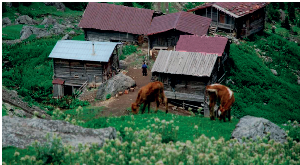
ალპური დასახლება აჭარაში. იაილები (სანალია) The Alpine Set- tlement in Ajara. Yails (Sanalia)

აჭარის საცხოვრებელი კომპლექსების ვერტიკალურ-ჰორიზონტული პრინციპით დაყოფის შედეგად გამოარჩევენ რამდენიმე ზოლს და აჭარულ, ლაზურ და ოდა-სახლის ტიპის საცხოვრებლებს. მეურნეობის ტრადიციული სახეები გავლენას ახდენს თითოეული ზოლისთვის დამახასიათებელი საცხოვრებელი ტიპის ჩამოყალიბებაზე. ქვემო აჭარაში - მიწათმოქმედება, ხოლო ზემო აჭარაში გავრცელებული მესაქონლეობა განაპირობებს საცხოვრებლის განსხვავებულ ფუნქციურ გადაწყვეტას.