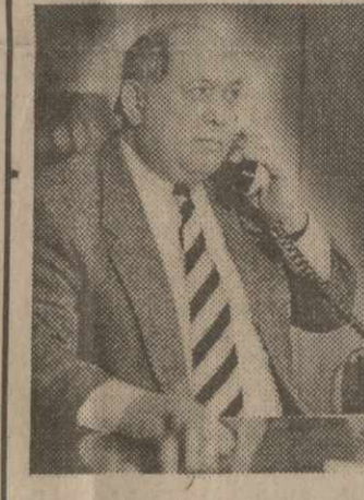
Сегодня в Москву с официальным визитом вылетает министр госбезопасности Грузии, генерал-лейтенант Шота Квирия. А накануне он дал эксклюзивное интервью "Свободной Грузии".

- Какова цель вашего визита? - Если коротко - разработка совместных мероприятий по усилению борьбы с терроризмом и организованной преступностью,