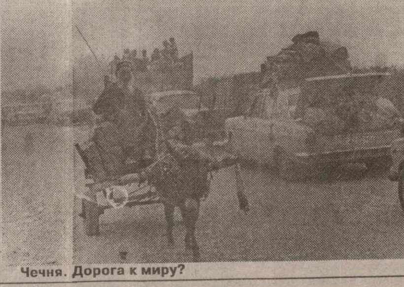
Чечня. Дорога к миру?