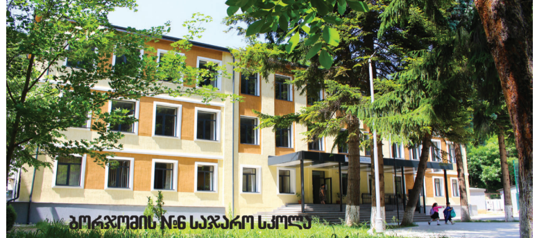
ბოკჯოში №6 საჯარო სკოლა

მუნიციპალიტეტის განსაკუთრებული ზრუნვის საგანს წარმოადგენს მოზარდებისათვის სპორტული მოედნების მოწყობის სამუშაოები. ამ მიზნით ბიუჯეტი ითვალისწინებს