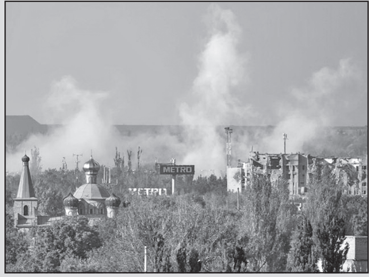
რუსეთის ევროკავშირის ახალი სანქციები დაეფუძრება, თუ სპარტანისტები ხელში ჩაიგდებენ დონეცკის აეროპორტს...