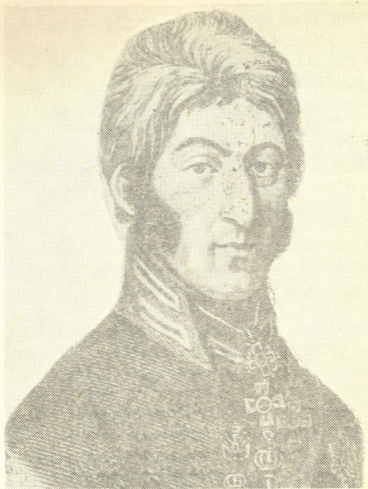
გენერალი პეტრე ივანეს ძე ბაგრატიონი

მიუხედავად იმისა, რომ ბაგრატიონის გეგმას ბევრი დადებითი მხარე ჰქონდა, რომელთა განხორციელებას დიდი სარგებლობის მო-