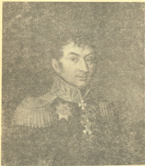
გენერალი ივანე დავითის ძე ფანჩულიძე

თან ბრძოლაში, რომლის გადამწყვეტ სტადიაში იგი „შეიჭრა“ მოწინააღმდეგის რიგებში და მანამდე ჩეხა, ვიდრე ტყვიამ არ დაჭრა მისი მხრები. 1806—1812 წლებში ივანე ფანჩულიძე რუსეთ-თურქეთის ომის ფრონტზე იყო. 1807 წელს მას გენერალ-მაიორის წოდება მიენიჭა.