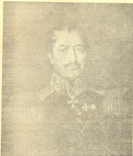
გენერალი ივანე სიმონის ძე ჯავახიშვილი

ავსტრიელთა კორპუსმა შვარცენბერგის მეთაურობით მდინარე ბუგი გადალახა და 19 ივლისს სლონიმში შევიდა. აქ მან რამდენიმე დღე დაჰყო საქსონიის კორპუსის მოლოდინში. ამ კორპუსს გენერალი