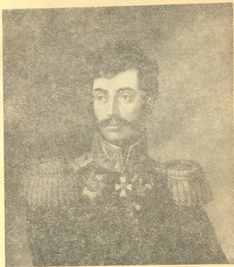
გენერალი რომან ივანეს ძე ბაგრატიონი

ბით ისახელეს თავი ალექსანდრიის პოლკის ჯარისკაცებმა და ოფიც- რებმა, რომელსაც პოლკოვნიკი რომან ივანეს ძე ბაგრატიონი გენერალ- რობდა. დოკუმენტში სახელწოდებით „სია გენერალ-ადიუტანტ გრაფ