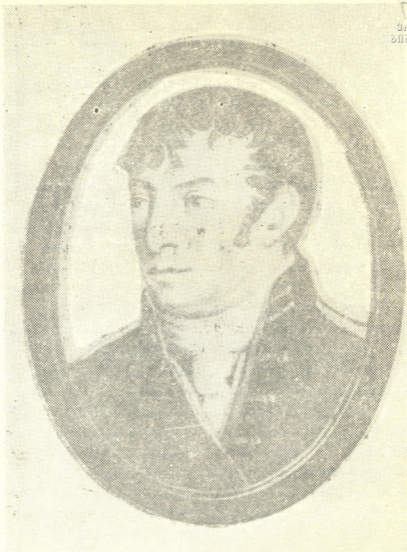
გენერალი ვლადიმერ მიხეილის ძე იაშვილი.

რუსეთს, აქვს უფლება ეს გითხრათ... მე ახლა უფრო დიდი ვარ, ვიდრე თქვენ, რადგანაც არაფერი არ მსურს და თუ თქვენი დიდების გადასარჩენად, რომელიც ჩემთვის ძვირფასია მხოლოდ იმიტომ, რომ იგი რუსეთის დიდებაა, საჭიროა ჩემი სიკვდილი, მე ამისათვის მზადა ვარ. მაგრამ ამას აზრი არა აქვს; მთელი ბრალი ჩვენ გვაწვება. მაგრამ ამაზე დიდ დანაშაულებსაც ფარავს სამეფო მანტია. მივდივარ ჩემს სოფე-