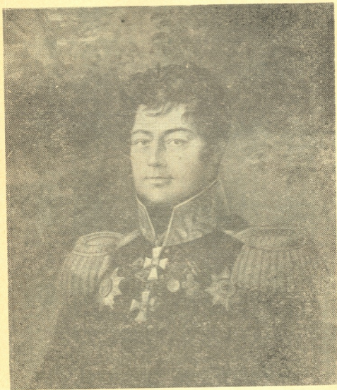
გენერალი სიმონ დავითის ძე ფანჯულიძე

1812 წლის სამამულო ომში სიმონ ფანჯულიძე მონაწილეობდა პირველი დღიდან უკანასკნელ ბრძოლამდე, რომელმაც დასრულდა რუსეთში შემოჭრილი ფრანგების განადგურება. ინგერმანლანდის დრა-