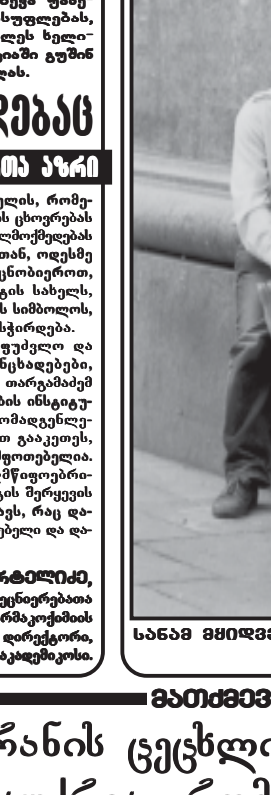
სანაბნო მუზეუმის გახსნის დასრულება.