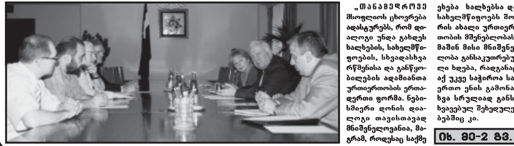
მინისტრები და სსიპის ხელმძღვანელები ერთობლივად შეიმუშავეთ გზებს გლობალიზაციის პროცესში ქართული ენის განვითარების ხელშეწყობის მიზნით