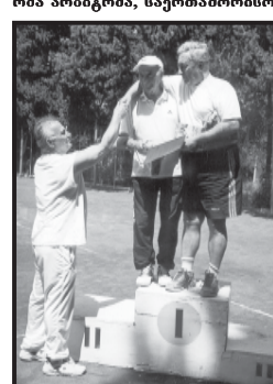
საქართველოს ფილოსოფიური მეცნიერებათა აკადემიის წევრები...