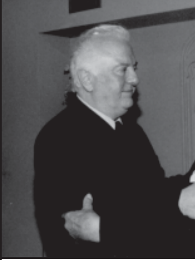
ბერმანის უმაღლესი ხელისუფლება აკმაყოფილებს საქართველოს პრეზიდენტის თხოვნას და ქართული კოსმოსური გეგმობის სკოლის გერმანულ აეროსპეციალურ კომპანიაში დასაქმებულ საქართველოში აგმანის ცნობად მოედარებს, დოქტორს, პროფესორს იოჰანეს მემლერს, რომელმაც თავისი მისია წარმატებით შეასრულა.

ენიჭებოდა ახალი თაობის საავიაციო-საგაერო სისტემებისათვის. მრავალი სინალები და წინააღმდეგობების მიუხედავად, დაუყოვნებლივ მივიღეთ გადაწყვეტილება თითქმის ერთი წლით კვლავ წავსუდეთ მისკოში, დასაშვებია და დაუშვებელი ფორმებით მომკვებებინა საბოლოო მასშტაბის საავიაციო-საგაერო სისტემის უმთავრეს კოსმოსურ კომპანიაში გასაგრძელებლად გამოცდის მომზადებასთან დაკავშირებით, რომელიც იქვე უნდა განხორციელდებოდა.