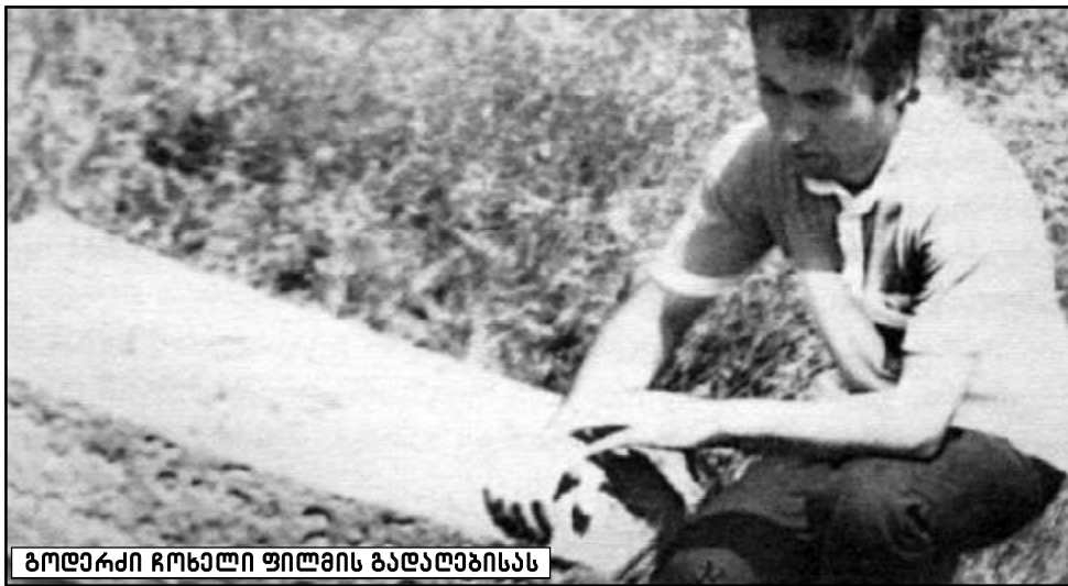
ბოდერი ჩოხელი ფილმის გადაღებისას

შვიდებდა, მაგას ყურადღება არ მიაქცია, გამომჩნობიან ისინიც, ვინც შენ კინოს გა-