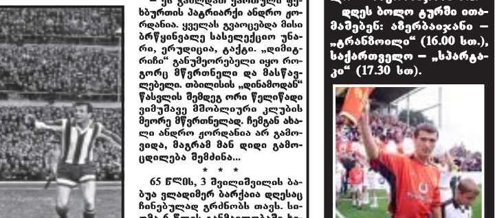
სპორტული ცენტრის მენეჯერმა... მატჩი წარმოადგინა...