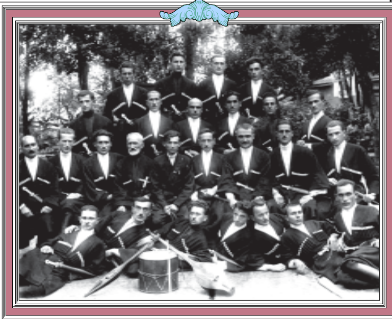
აზნაშვილის სიმღერისა და ეკლასის სახელმწიფო ანსამბლი. გადარღვნილია 1932 წელს.