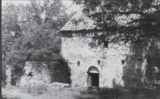
... 2002 წლის აგვისტოს 2-ს, აიკოთ თარაშვილის საფლავზე შეიკრიბა სამღვდლოება და ქართველი სამოციქულოები...