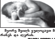
მეორე ვილს უკუოცათ მარინის და ლერის.