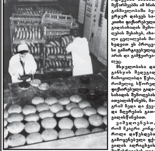
მარაბა დღემ, რაც ფიზიოლოგიურ ნორმასთან შედარებით...