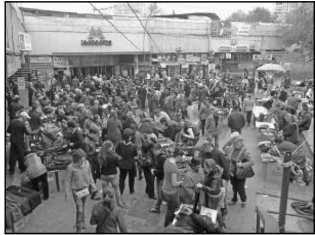
დედაქალაქის სხვადასხვა უბანში სავაჭრო ვითარება ისევე ადრე არსებულ ქალაქურ მდგომარეობას უბრუნდება. თუ ოქტომბრის არჩევნების

რიდის, მეტროს სხვა სადგურების მიმდებარე ტერიტორიებზე, მაგრამ ყველას, როგორც ჩანს, მეტროს სადგურ ახმეტელთან ბოშების მიერ ახლახან გამართულმა ბანაკმა „მოუფოკრა“. აქ ერთბაშად, ყოველგვარი ექვსის გარეშე, სრულიად ორგანიზებულად, უამრავი წვრილმანით მოვაჭრე ბოშა გამოვიდა თავისი „დაცვის სამსახურის“ თანხლებით და სახელდახელო ბაზრობა ისე მოეწყო, ხალხს მეტროში თავისუფლად ჩასვლა-ამოსვლის შესაძლებლობა უაღრესად შეზღუდდა. ნაშუადღევს კი ამ ადგილზე სულ რამდენიმე პოლიციის თანამშრომელი იმყოფება, რომლებსაც აღუფრთხვავებლად მოქალაქეთა მიმართებულ მხოლოდ ერთი პასუხი აქვთ – ამდენ ხალხს ჩვენ ვერაფრით მოვუვლით, საამისოდ ათჯერ მეტი მაინც უნდა ვიყოთ. ჰოდა, იქნებ გაავაგებინოთ, რას ფიქრობენ ამის თაობაზე რაიონების გამგებლობები, ქალაქის მესვეურნი?