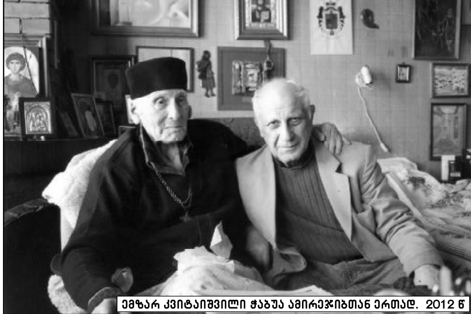
ამჟამად კვირავილი შაბათი ამირაჯიბთან ერთად. 2012 წ.

არ მომზორდა წვალემა, მტეხავ, მუხლის ძვალო!.. წაგებულმა ვერა-რა