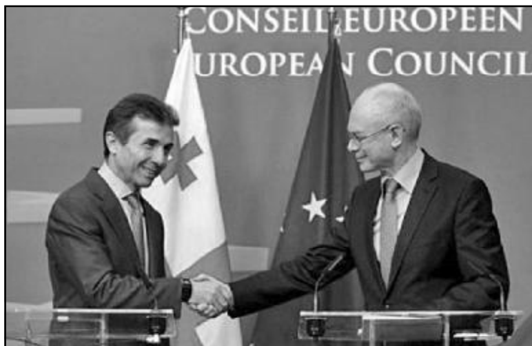
მხრიდან გაკეთებული განცხადებებით იმედგანობილება მივიღეთ. რუსეთის მხრიდან ურთიერთობის შესახებ რეაქცია არ იყო. ისევე ველოდებით და იმედი გვაქვს,

რომ რუსეთის ხელისუფლება ვითარების შემდგომ ანალიზს გააკეთებს და შესატყვის ნაბიჯს გადადგამს. ესკალაცია, ის მდგომარეობა, რომელიც დღეს