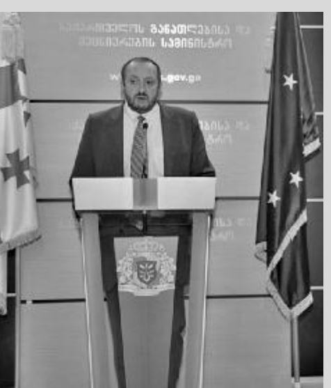
საქართველოს განათლებისა და მეცნიერების მინისტრის გიორგი მარგველაშვილი

როგორც განათლების მინისტრმა გიორგი მარგველაშვილმა განაცხადა, აღნიშნულ თემაზე თუ იმუშავებენ შედეგად, მშობლები და ჟურნალისტები, ორი კვირის განმავლობაში სამინისტროში უნდა წარმოადგინონ თავიანთი შეხედულებები წერილობითი სახით. როგორც მინისტრმა ბრძანა, საერთო აზრის ფორმირების შემდეგ, საგარეუდოდ, კანონმდებლობაშიც შევა ცვლილება და უკვე ახალი კანონმდებლობის საფუძველზე, მოსწავლე აღარ გაირიცხება სკოლიდან და სწავლის პარალელურად, მათთან იმუშავებენ ფსიქოლოგები, ან იმ პროფესიის წარმომადგენლები, რა კუთხითაც მოსწავლეს დახმარება დასჭირდება.