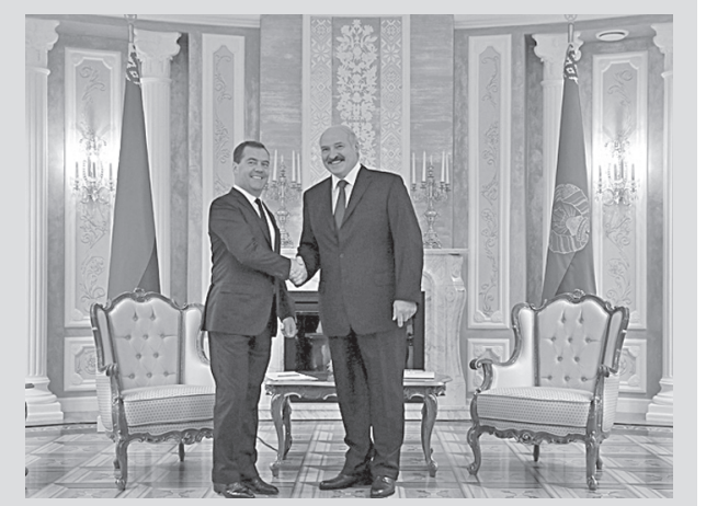
ლუკაშენკოს და პუტინის ვიზიტი მინსკში, რომელიც დასრულდა 23 ოქტომბერს. რუსეთის საგარეო უწყებების განცხადებით, ეს შეხვედრა იმისთვის გაიმართა, რომ დაინტერესებულია ვლადიმერ პუტინთან შეხვედრით იმ შემთხვევაში, თუ რუსეთის მხარე გამოთქვამს მზადყოფნას, განვიხილოთ „მტკივნეული თემები“.

აღსანიშნავია, რომ, მართალია რუსეთის ფედერაციის პრემიერ-მინისტრმა დაგვარწმუნა, რომ სადავო საკითხები ორი ქვეყანას შორის არ არის, თუმცა როგორც ჩანს, ეს შეხვედრა ისევე არ მომხდარა პუტინის ჩაურევლად, აღნიშნავენ მასობრივი ინფორმაციის საშუალებები. როდესაც მედვედევმა უკვე სტუმრად იყო ლუკაშენკოსთან, კრემლის ოფიციალურმა საიტმა გაავრცელა ინფორმაცია რუსეთის პრეზიდენტის ბელარუს კოლეგასთან ტელეფონით საუბრის შესახებ.