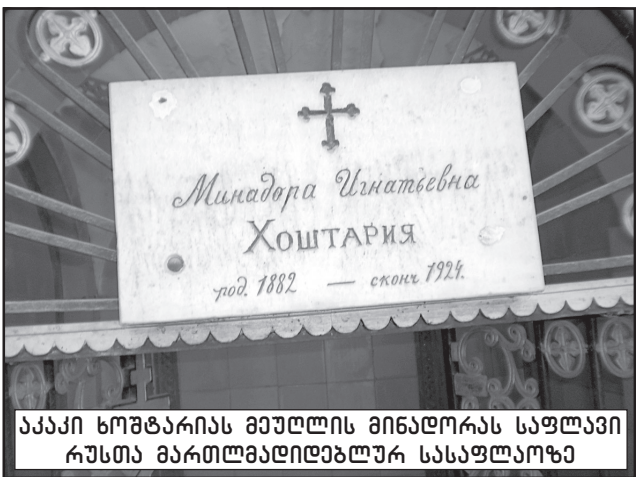
აკაკი ხოშტარიას მეუღლის მინდორას საფლავი რუსთა მართლმადიდებლურ სასაფლაოზე