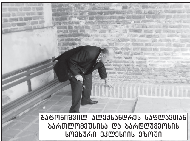
ბატონიშვილ ალექსანდრეს საფლავთან ბარტლომეუსისა და ბარდლუმეოსის სომხური ეკლესიის ეზოში