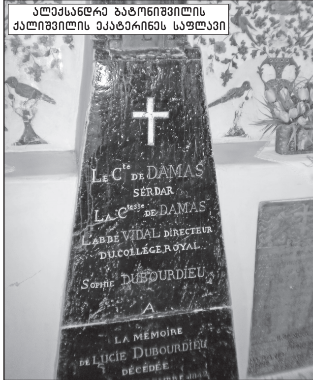
ალექსანდრე ბატონიშვილის ქალიშვილის აკატარინის საფლავი

ნოდარ კობერიძე, თეირანე-ბაქო-თბილისი 9-13 ოქტომბერი