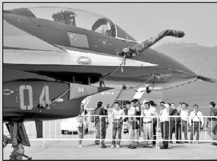
ჩინეთს რუსეთის აზიამბაზი ალარ ზურბის: იგი მისჩინებდა სამხედრო-საპატიმრო კალაპის უახლეს ტიპის და სურს ტიპოლოგიის მიღება