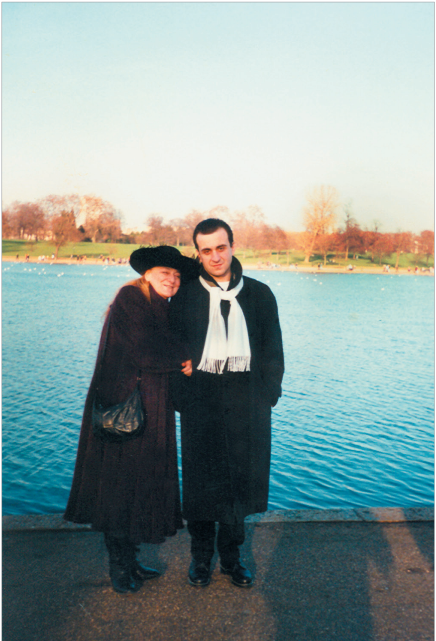
Мать и сын. Лондон 2004 г.