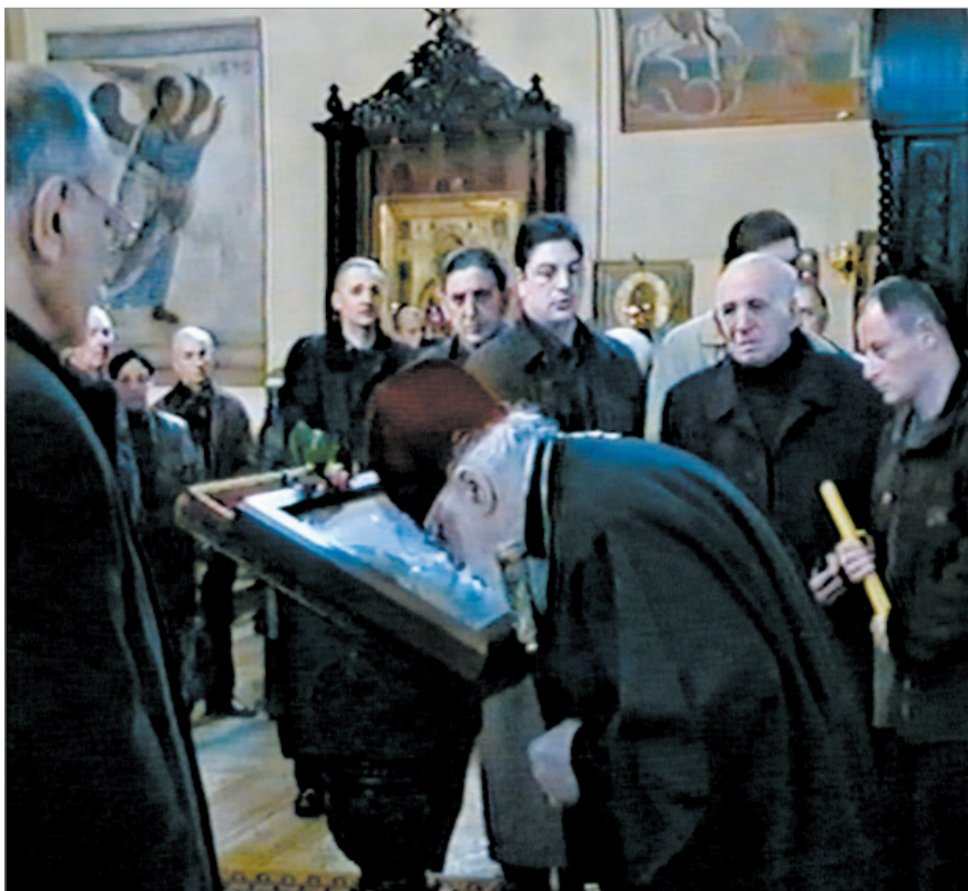
Панахида по Георгию. Апрель 2006 г. Кафедральная церковь Сиони.