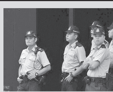
ჩინეთში დაბრუნდა მკვლარი „პატარაქალი“ მომსახრე ბანდა მკვლი რიტუალისათვის

პოლიციის მონაცემებით, დაკავებული ბანდა საფრანგულიდან ამოიღეს გარდაცვლილი ქალის ცხედარი, რომელიც შუამავალს მიჰყიდეს 18 ათას იუანად (თითქმის 3 ათასი დოლარი). მოგვიანებით ცხედარი მოხვდა შავ ბაზარზე, სადაც გაყიდეს ძველი რიტუალის „ინჰუნი“ (გარდაცვლილთა ქორწინება) შესრულებისათვის.