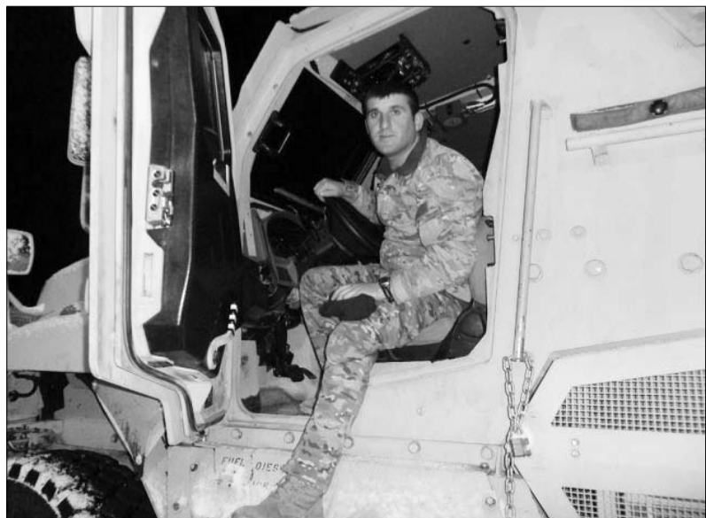
ირაკლი ანსაფის მისიაში, ავღანეთში