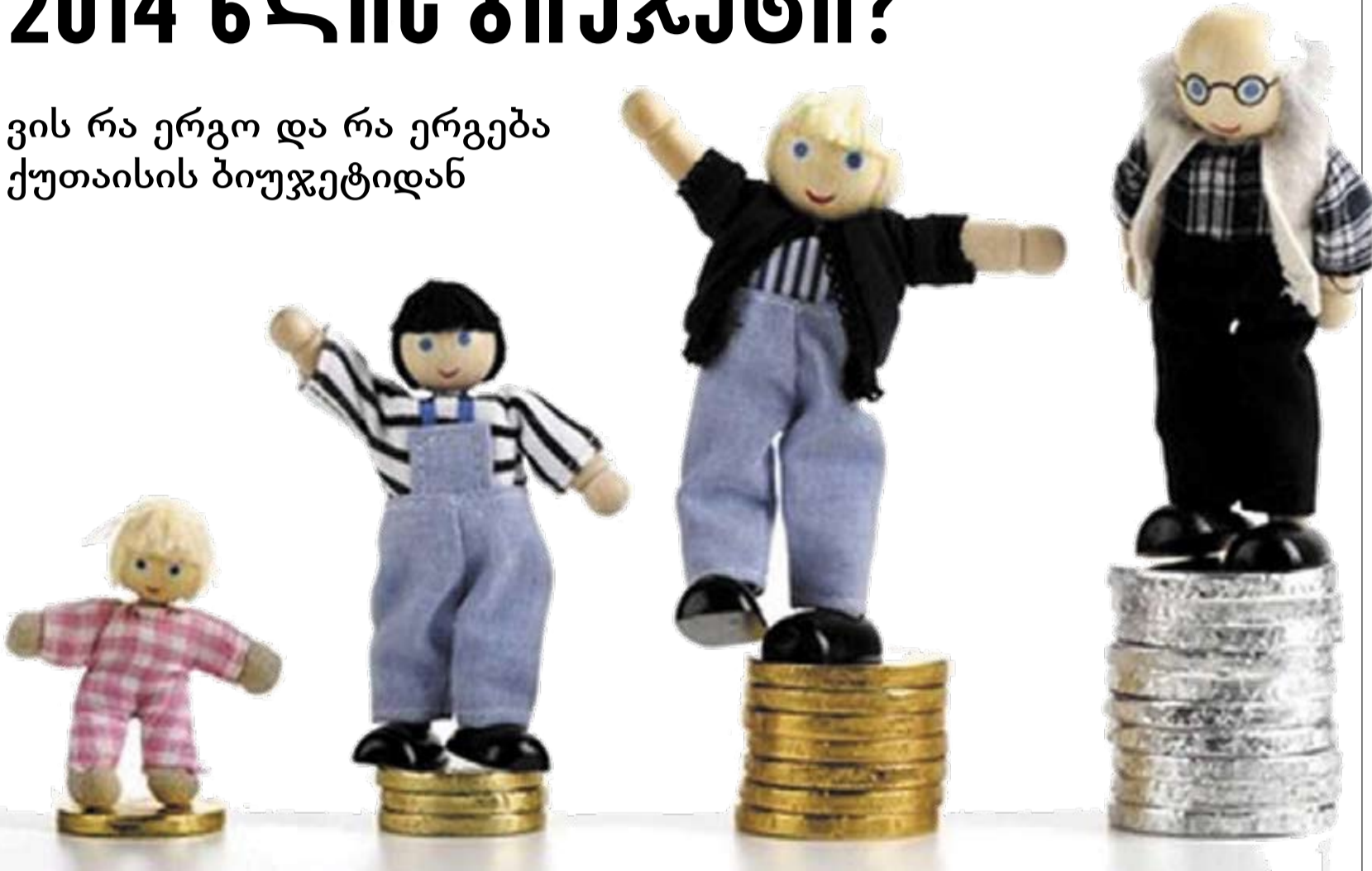
იხილეთ მე-2 გვერდზე

ვის რა ერგო და რა ერგება ქუთაისის ბიუჯეტიდან