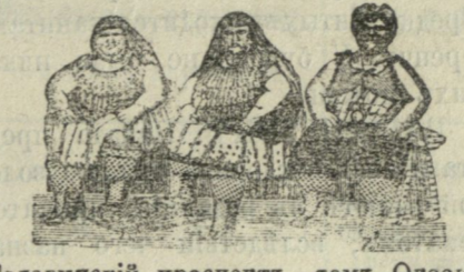
Головинскій проспектъ, домъ Окоева, № 46, рядомъ съ циркомъ.

МАРСЪ ОСИПОВИЧЪ ФИШЕРЪ принимаетъ просителей ежедневно, отъ 11 до 12 час. пополудни, въ помѣщеніи тифлисскаго комитета торговли и мануфактуръ, что на Сергіевской улицѣ, д. № 1. К. 107 (5) 3.