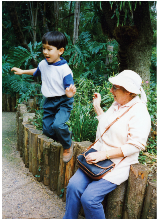
35. ბებია და შვილიშვილი