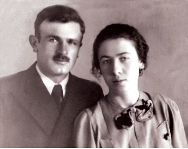
9. ჯარში გაწვევამდე