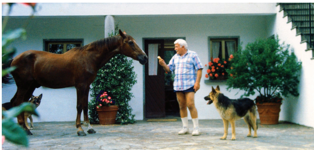
30. ეთერისთან იტალიაში