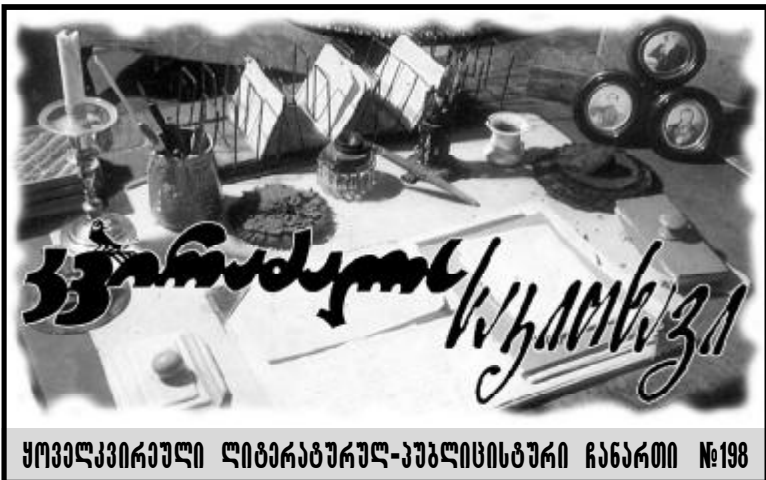
ყოველკვირული ლიტერატურულ-კულტურული ჩანაწერი №198