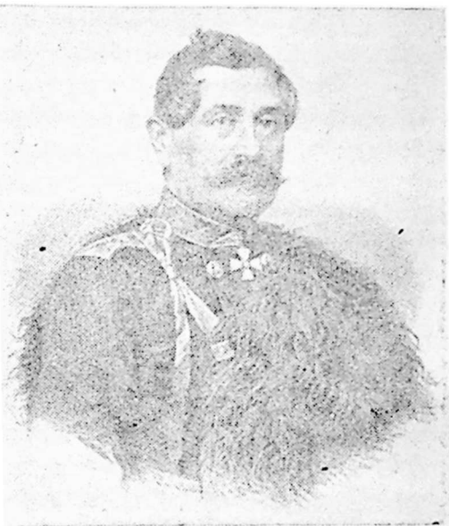
გენ. ივ. ბაგრატიონ-მუხრანსკი

გურიის რაზმის ოპერატიული მოქმედება გეგმით იმგვარად იყო გაანგარიშებული, რომ მოწინააღმდეგეს არ მისცემოდა გაბედული და გადამწყვეტი მოქმედების შესაძლებლობა. გურიის რაზმის შენაერთებს, შეძლებისდაგვარად, გვერდი უნდა აექციათ მტრის გადამეტებულ ძალებთან შეხვედრისათვის (განრიდება უთანასწორო ბრძოლის არახელსაყრელი მდგომარეობისაგან 1 ). განსაკუთრებით უნდა აღინიშნოს, რომ ბაგრატიონ-მუხრანსკის გეგმაში მნიშვნელოვანი ადგილი ეკავა პატრიოტიზმის გრძნობის გამაღვივებელ ღონისძიებათა გატარებას მოსახლეობაში, ბრძოლისათვის სახალხო ომის ხასიათის მიცემას. გურიის რაზმის უფროსის რწმენით, ყველა ადგილობრივი პირობა ხელს უწყობდა ამას 1 .