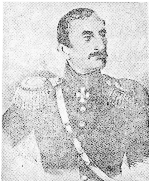
გენ. ვ. ბებუთოვი

გენ. ბებუთოვის მიმართვა „მეგრელების, იმერლებისა და გურულებისადმი“, რომელიც ნოემბრის დასაწყისს გამოქვეყნდა, უპასუხებდა მოსახლეობის მთელი მასის სულისკვეთებას. „შეიარაღდით ყველანი, შეიარაღდით თქვენი გლეხები და მსახურები, — მოუწოდებდა გენ. ბებუთოვი თავადებსა და აზნაურებს, — შეუერთდით ძღვევამოსილ რუსეთის მხედრობას და დაუმტკიცეთ მტერს, რომ თქვენ ხართ შეილები იმ გულადი იმერლებისა, გურულებისა და მეგრელებისა, რომელთა მოდრეკა მან ძველ დროშიაც ვერ შესძლო. ახლა თქვენგან არის დამოკიდებული, რომ ომი ახდეს სახალხო და იგი ყველგან წარმოებდეს. თქვენი მამაცობა და სისწრაფე დამტკიცებულია. დაე, თვითეულ ბუჩქთან, თვითეულ ხევსა და ღარტაფში, თვითეული ქვების გროვის უკან და ყოველ ადგილას მტერი სიკვდილს ელოდეს; დაე, მან გაიგოს, რომ თუმცა იგი ღირსი არაა დაიმარხოს ქრისტიანთა წმინდა მიწაში, მაგრამ თქვენ ჩაფლავთ მას იქ, სადაც არ გაისმის ეკლესიების ზარების ხმა და სადაც მარტოოდენ გარეული მხეცები დაძრწიან. მაშ, ასე... წინ, მტრის გასაძევებლად!“ 1 .