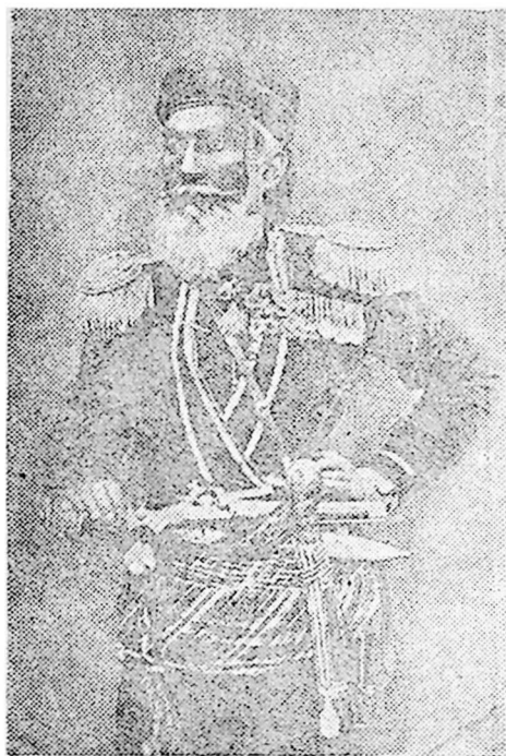
ქართული ლაშქრის მეთაურის ცხი.

1854 წელს ადგილობრივი მილიციის ჩინებულმა იერიშმა გადაწყვიტა ნ.ალაუკის ბრძოლის ბედი, ძლევამოსილად დაამ-