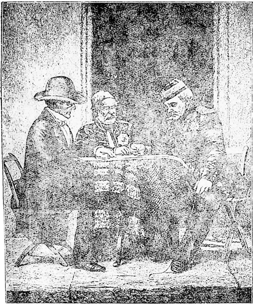
ლორდ როგლანი ომერ-ფაშა გენ. პელისიე (1855).