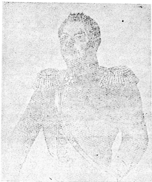
გენ.-ლეიტ. ივ. ანდრონიკაშვილი

კ. მარქსი და ფ. ენგელსი, რომლებიც სათანადოდ აფასებდნენ შამილის დივერსიულ მოქმედებას რუსეთის კავკასიის არმიის ზურგში, სტატიაში „საღვთო ომი“ წერდნენ, რომ თურქეთი თავისი წინსვლით კავკასიაში, სულ ერთია ბათუმიდან თუ არზრუმიდან, წარმატების შემთხვევაში, დაამყარებს პირდაპირ კავშირს თავის მოკავშირეებთან, მთიელებთან და შესძლებს ერთი დარტყმით მოწყვიტოს, ყოველ შემთხვევაში ხმელეთით მაინც, სამხრეთ კავკასიის არმია რუსეთს. ამას კი შეუძლია სრულ განადგურებამდე წიყვანოს რუსეთის არმიაო 2 .